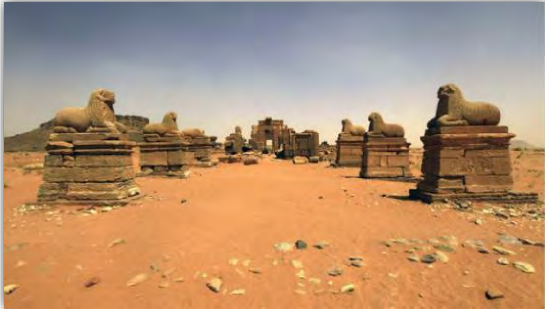
Ναός του Άμονα