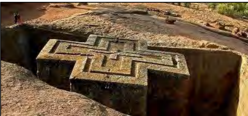
Κοιλιάδα του Όμο

Αναχώρηση οδικώς για το Άρμπαμίντς. Άφιξη και τακτοποίηση στο ξενοδοχείο.