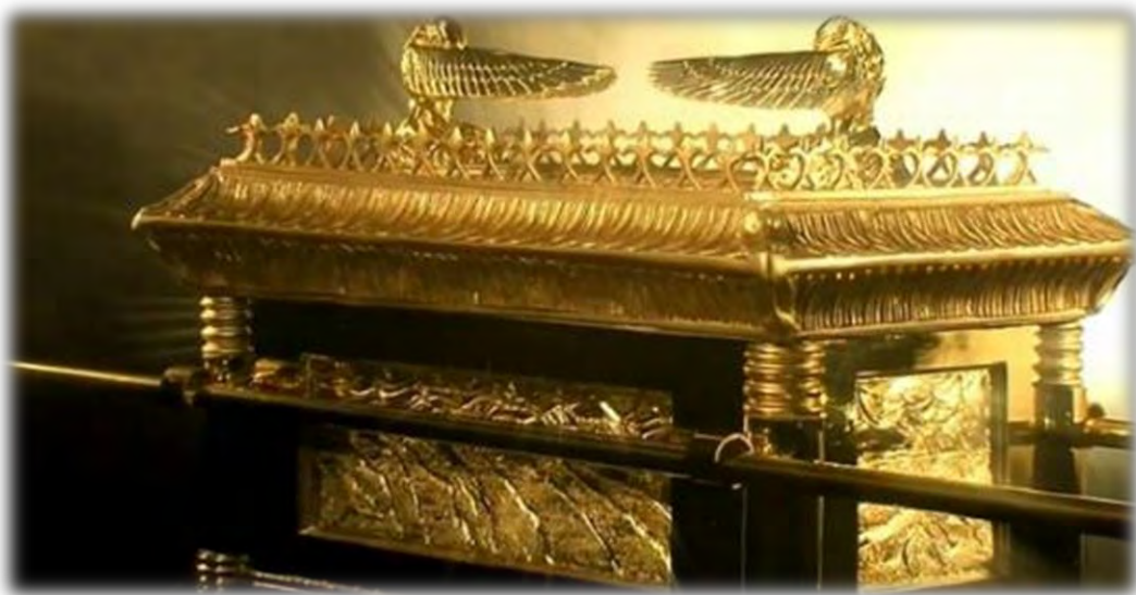
Η κιβωτός της διαθήκης

Νωρίς το πρωί μεταφορά στο αεροδρόμιο και πτήση για το ιστορικό Αξούμ, έδρα του περίφημου Βασιλείου της Αζωμής που για έντεκα αιώνες αποτέλεσε έδρα ισχυρότατων βασιλέων που επέκτειναν τα εδάφη τους μέχρι την Ασιατική Ήπειρο. Η ολοήμερη ξενάγηση της πόλης θα ξεκινήσει από τους περίφημους οβελίσκους, ο μεγαλύτερος εκ των οποίων επεστράφη στην Αιθιοπία από τους Ιταλούς μόλις λίγα χρόνια πριν. Το αποκορύφωμα όμως θα είναι η επίσκεψη στην εκκλησία της Παρθένου όπου φυλάσσεται η Κιβωτός της Διαθήκης η οποία αποτελεί ύψιστο σκεύος του Μονοφυσικού Χριστιανισμού. Η μέρα μας θα κλείσει με επίσκεψη στο Αρχαιολογικό Μουσείο.