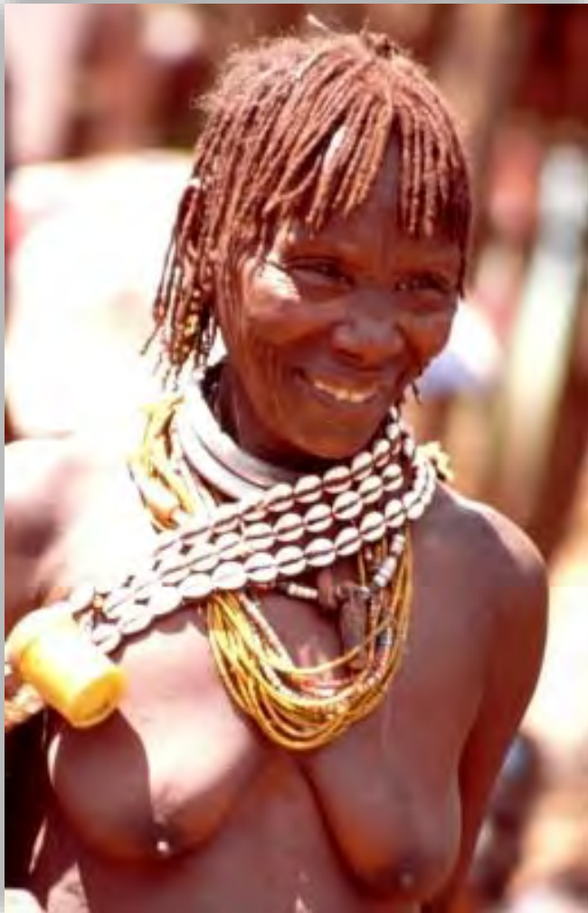
Γυναίκα φυλής Χάμερ

Νουβίας. Πρώτο αξιοθέατο ο εκπληκτικός ναός της πόλης στην περιοχή της Ντεφούφα. Πρόκειται για μία εξαιρετική κατασκευή από αρχιτεκτονικής άποψης 19 μέτρα ύψος φτιαγμένη από... λάσπη! Τέλος, η επίσκεψή μας στην πόλη θα ολοκληρωθεί με την επίσκεψη στο τοπικό Ιστορικό Μουσείο της Κέρμα. Στη συνέχεια, ακολουθώντας την πορεία του Νείλου θα διασχίσουμε μοναχικά τοπία, που ζωντανεύουν από μικρές ζωηρές ομάδες νομάδων, που ζαλισμένοι κι αυτοί απ' τον καυτό ήλιο της ερήμου αναζητούν λίγη πρόσκαιρη δροσιά και τροφή για τα ζώα τους στις όχθες του ποταμού. Το απόγευμα θα φτάσουμε στην Ντόνγκολα.