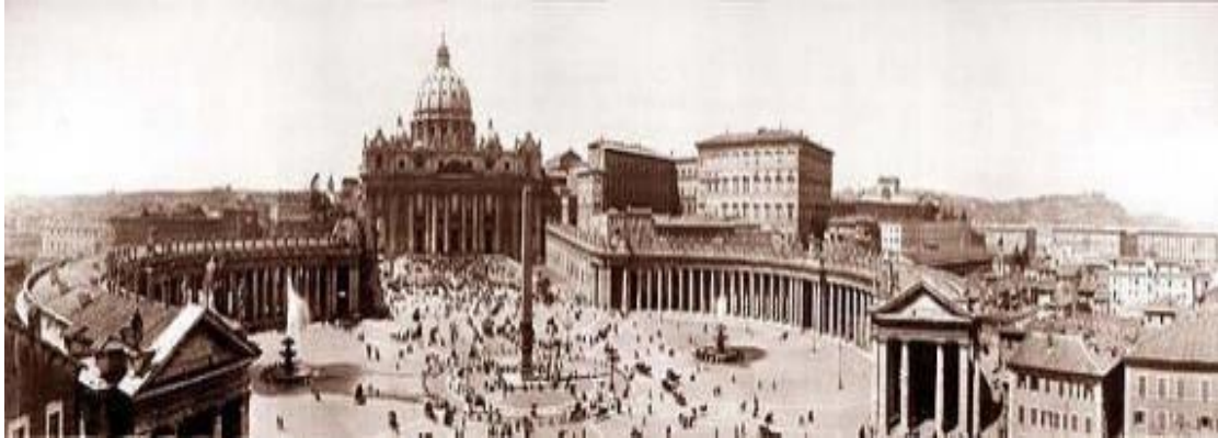
Βασιλική του Αγ. Πέτρου

Η Βασιλική του Αγίου Πέτρου βρίσκεται στο Βατικανό και είναι χτισμένη πάνω από το σημείο ταφής του Αποστόλου Πέτρου. Μπορεί να χωρέσει 60.000 άτομα ενώ με την συνολική έκταση ολόκληρου του αρχιτεκτονικού συγκροτήματος αποτελεί και μία από τις μεγαλύτερες εκκλησίες του κόσμου.