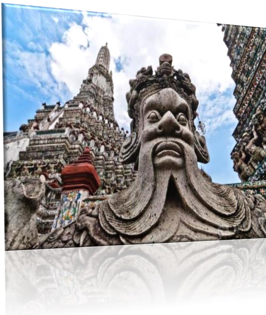
Ναός της Αυγής - Wat Arun

ΣΗΜΕΙΩΣΗ: Η ροή του προγράμματος ενδέχεται να διαφοροποιηθεί χωρίς να παραλείπεται κάτι.