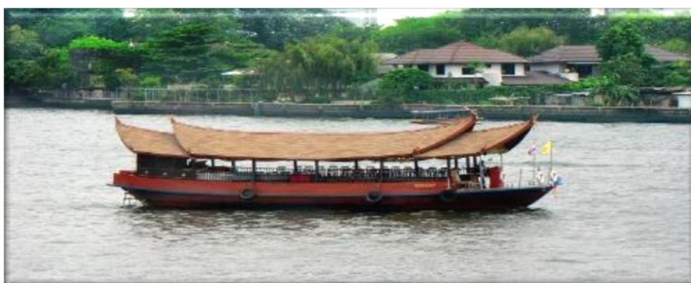
Γλοιάριο στον ποταμό Τσάο Πράγια