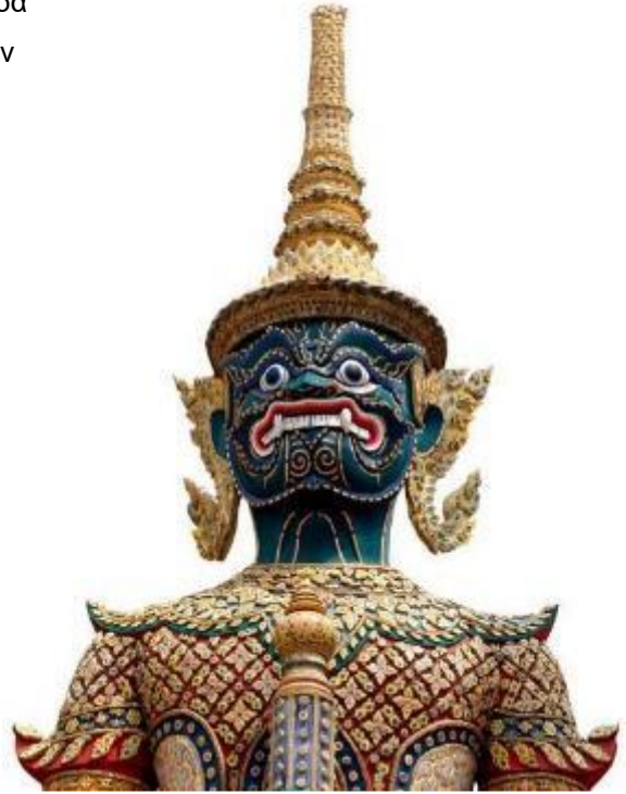
Ο Σμαραγδένιος Βούδας

Τα αναλυτικά μας προγράμματα είναι πλήρη και λεπτομερή. Όσοι ταξιδεύουν μαζί μας γνωρίζουν πολύ καλά ότι τιμούμε την επιλογή των ταξιδιωτών, προσφέροντας τα πληρέστερα και πιο καλο-σχεδιασμένα ταξίδια. Οι ξεναγήσεις μας είναι μελετημένες, οι τοπικοί ξεναγοί άρτια καταρτισμένοι και οι υπηρεσίες των τοπικών μας αντιπροσώπων υψηλότατων απαιτήσεων.