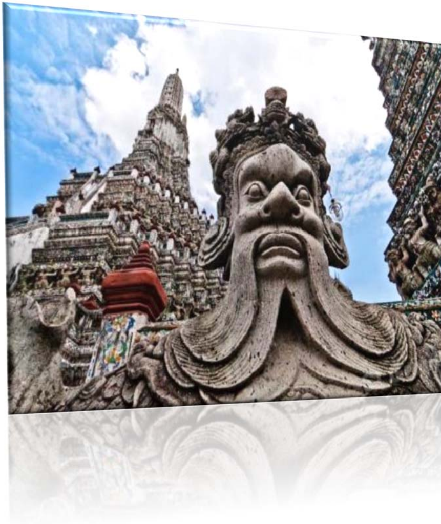
Ναός της Αυγής - Wat Arun

ΣΗΜΕΙΩΣΗ: Η ροή του προγράμματος ενδέχεται να διαφοροποιηθεί χωρίς να παραλείπεται κάτι.