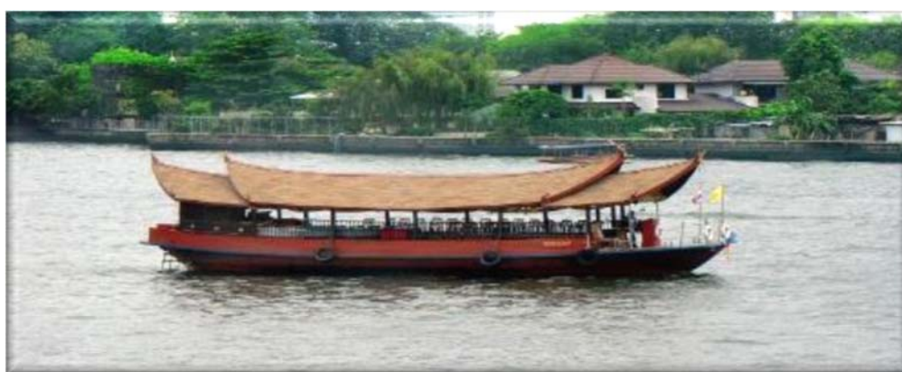
Πλοιάριο στον ποταμό Τσάο Πράγια