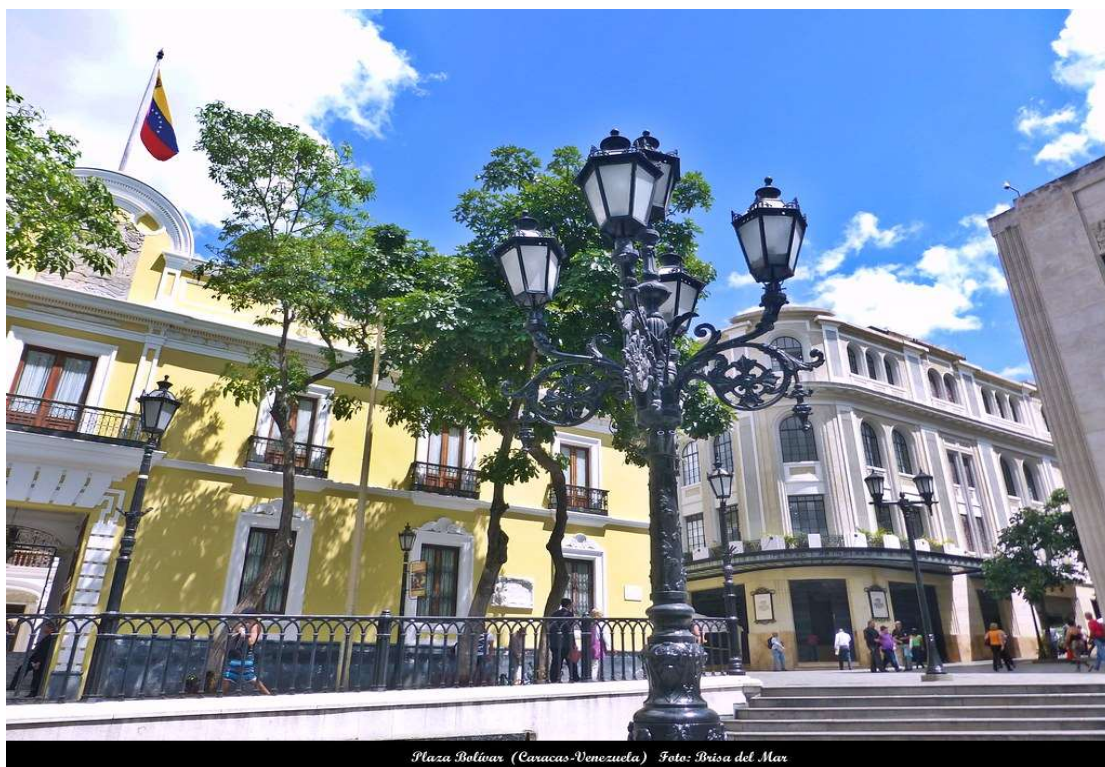
Plaza Bolívar (Caracas-Venezuela)