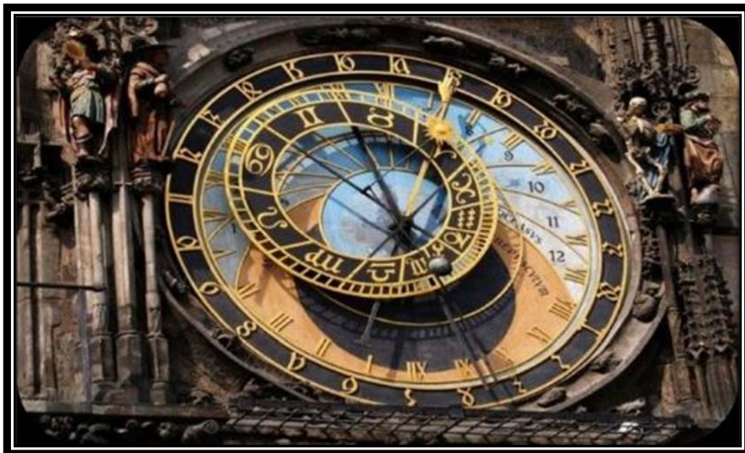
Το Αστρονομικό Ρολόι