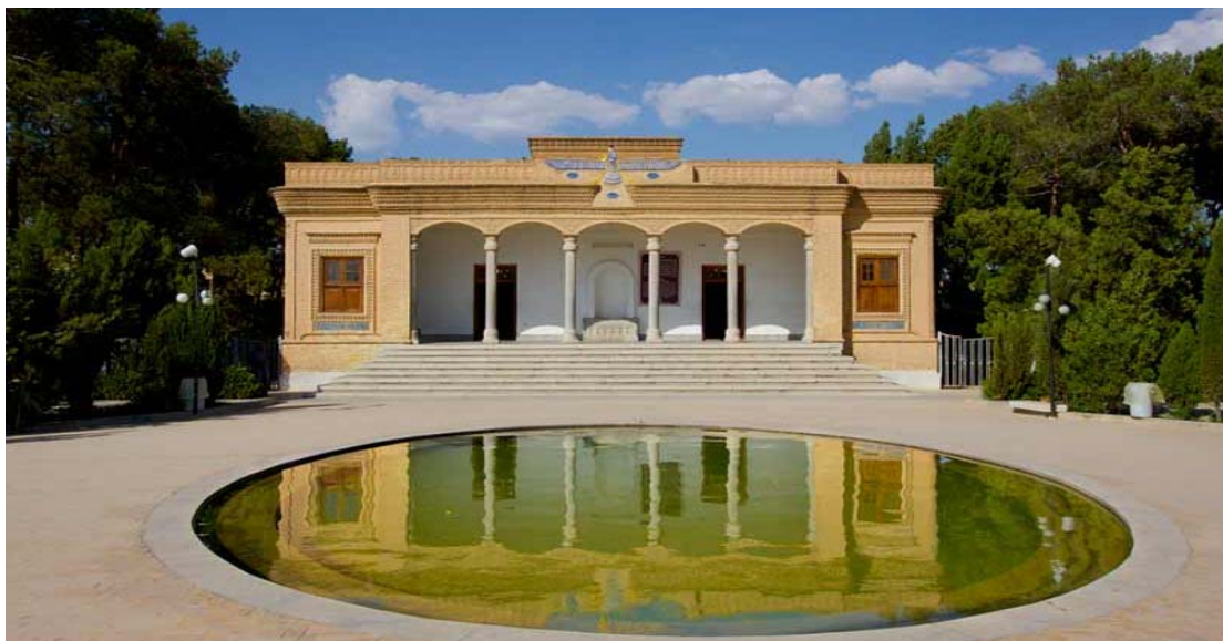
Ο Ζωροαστρικός Ναός στη Γιαζντ