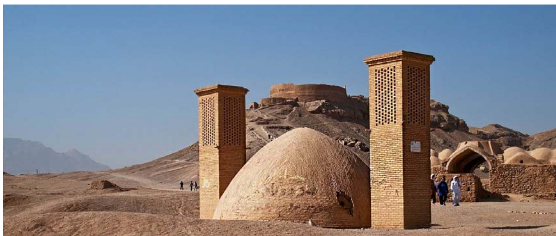
Οι Πύργοι της Σιωπής στο Γιαζντ

Νωρίς το πρωί ξεκινάμε για τα δυτικά της χώρας. Διασχίζοντας τις μεγάλες αλμυρές ερημικές εκτάσεις φτάνουμε το μεσημέρι στο Γιαζντ. Πλησιάζοντας στην πόλη θα σταθούμε να ατενίσουμε τους Πύργους της Σιωπής , το χώρο όπου μέχρι το 1950 τοποθετούνταν οι νεκροί των Ζωροαστρών προκειμένου να φαγωθούν από τα όρνια, όπως επέβαλε η παράδοση. Κορυφαίο αξιοθέατο της σημερινής μέρας η επίσκεψή στο ναό των Ζωροαστρών . Πρόκειται για μια λιτή κατασκευή που τη στολίζουν τα σύμβολα του Θεού Άχουρα Μάζντα, ενώ στο χώρο φυλάσσεται και η άσβεστη Φλόγα. Συνεχίζουμε τη γνωριμία μας με την μεσαιωνική Γιαζντ, γνωστή και ως «Η Ευγενής Πόλη Της Ερήμου». Θα ξεναγηθούμε στη μαγική καλοδιατηρημένη παλιά πόλη , χτισμένη από πηλό που είναι ένα αριστούργημα αρχιτεκτονικής. Ένας λαβύρινθος από στενούς δρόμους και κάπου στον ορίζοντα να δεσπόζουν οι πύργοι των ανέμων , ευφύεστατες κατασκευές για την διατήρηση της θερμοκρασίας σε χαμηλά επίπεδα κατά την διάρκεια του ζεστού καλοκαιριού.