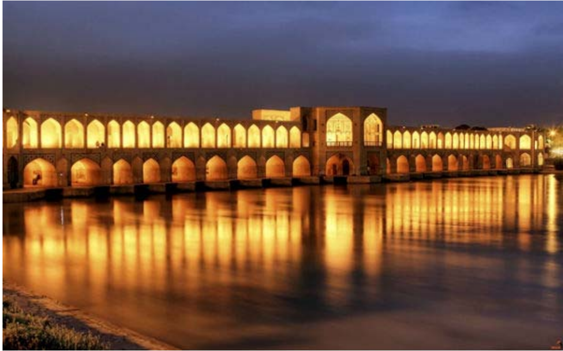
Φωταγωγημένη γέφυρα στο Ισφαχάν