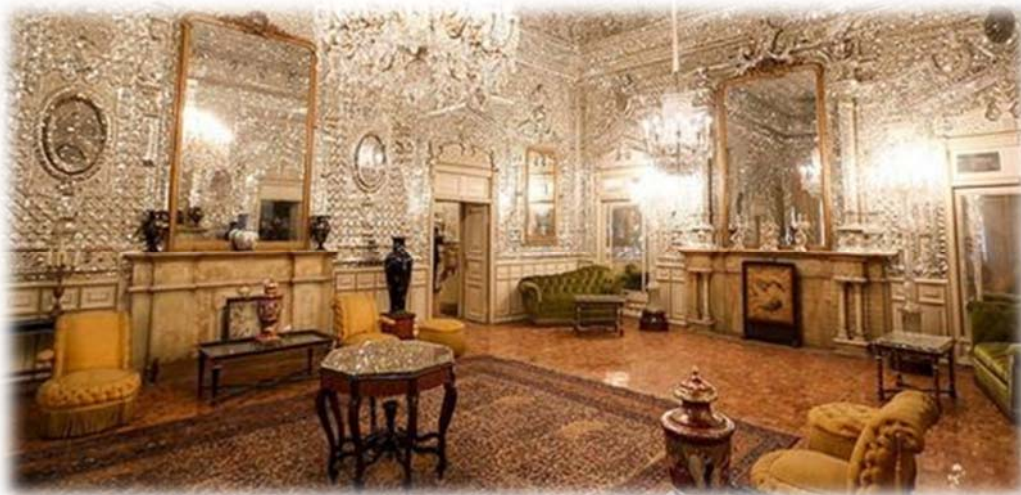
Το εσωτερικό του παλατιού Γκολεστάν