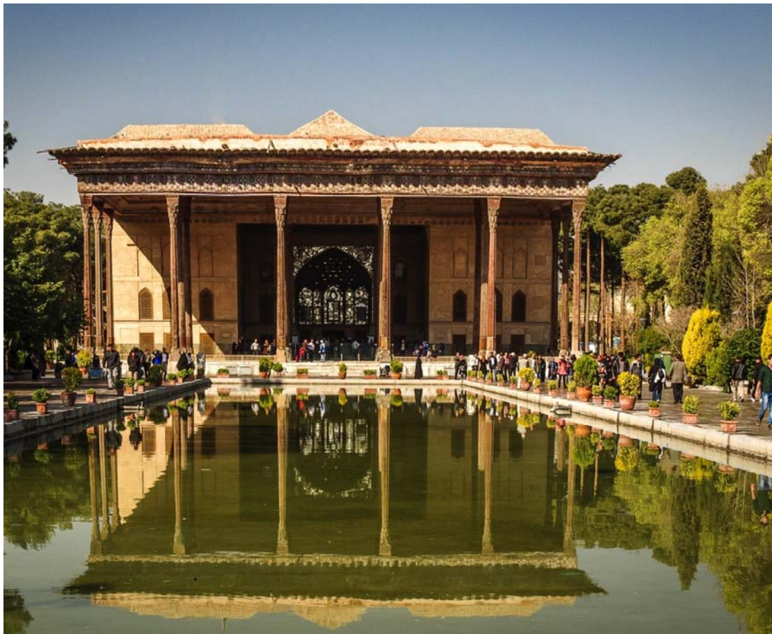
Το Παλάτι των 40 Κιόνων