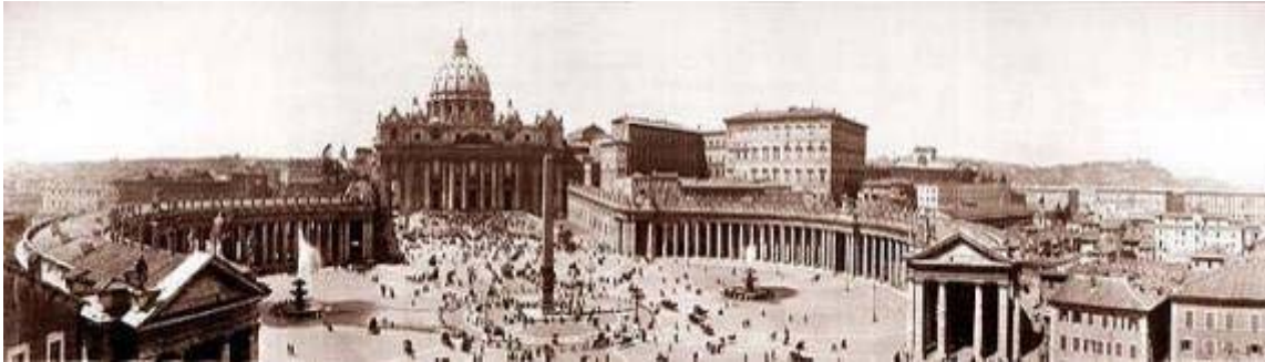
Βασιλική του Αγ. Πέτρου