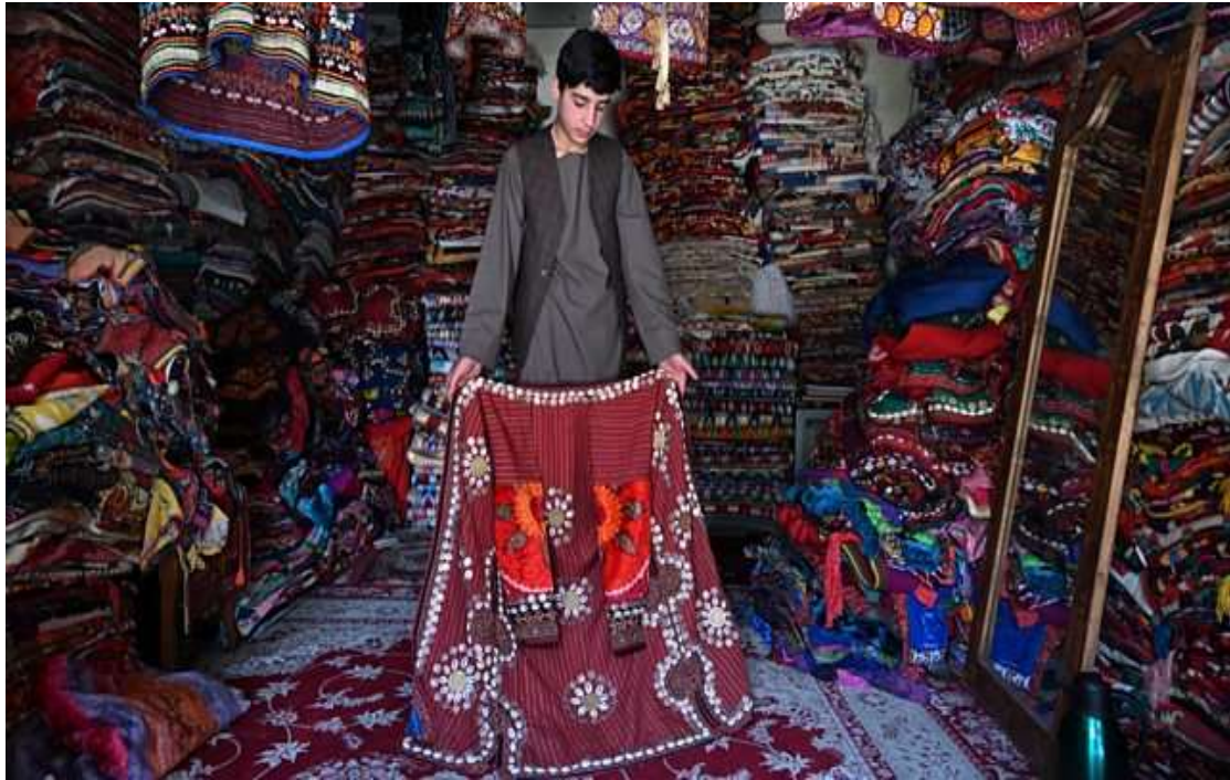
Πωλητής χαλιών στην αγορά της Ακσα