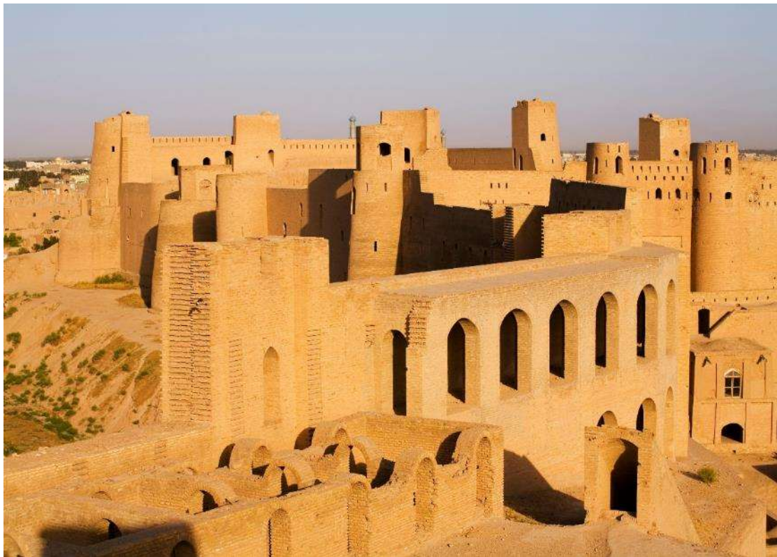
Η σιπαντέλα στη Χεράτ