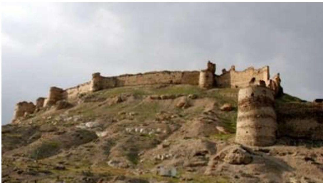
Το κάστρο Μπάλα Χισάρ στη Καμπούλ