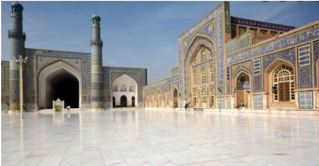
Το μεγάλο Τζαμί στη Χεράτ

Σήμερα η μέρα είναι αφιερωμένη στην αεροπορική πρόσβαση στο δυτικό Αφγανιστάν. Η σύντομη πτήση θα μας φέρει στην Χεράτ, γνωστή στην αρχαιότητα σαν Αλεξάνδρεια Αρείων . Απογευματινή ξενάγηση στην γραφική πολιτεία, μία από τις σημαντικότερες της Κεντρικής Ασίας όπου η ζωή ακολουθεί ακόμη τους ρυθμούς των περασμένων αιώνων. Θα φωτογραφηθούμε μπροστά στην Ακρόπολη που πρωτοχτίστηκε από τον Αλέξανδρο όταν ίδρυσε την πόλη, θα σεργιανήσουμε στα παζάρια και θα δούμε το μεγάλο τζαμί με τα περίτεχνα γαλαζωπά πλακίδια περσικής επίδρασης.