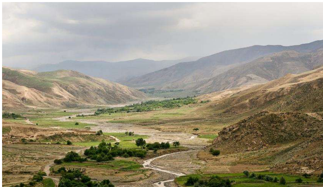
Η διαδρομή μας προς το Κουντούζ

Πολύ νωρίς το πρωί θα ακολουθήσουμε την διαδρομή μας πάνω από τα ορεινά περάσματα του Ινδοκούς που θα μας φέρει από το ιρανικό οροπέδιο στις ανοιχτές πεδιάδες του Κεντρικής Ασίας. Αργά το απόγευμα θα καταλήξουμε στο Κουντούζ για διανυκτέρευση.