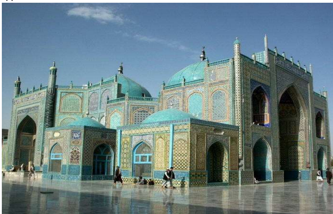
Το Τέμενος του Αλί στο Μαζάρ Σαρίφ

Διασχίζουμε τις πεδιάδες της Κεντρικής Ασίας και καταλήγουμε το μεσημέρι στο Μαζάρ Σαρίφ, την μεγαλύτερη πόλη του βόρειου Αφγανιστάν. Το απόγευμα θα επισκεφθούμε το τέμενος του Αλί, ίσως το πιο εντυπωσιακό ισλαμικό κτίσμα στο σημερινό Αφγανιστάν.