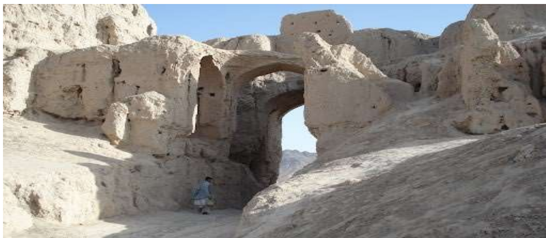
Η Αλεξάνδρεια εν Όξω

Αλεξάνδρεια η Οξειανή!!! Την χαμένη πολιτεία των Ελλήνων στο φαράγγι του Ινδοκούς θα αναζητήσουμε σήμερα. Μακριά από κάθε γνωστή πόλη του αρχαίου και του νέου κόσμου στις εσχατιές του Αφγανιστάν, η Αλεξάνδρεια εν Όξω θυμίζει με τα λιγοστά της ερείπια την επέκταση του ελληνικού πολιτισμού στα βάθη της Ασίας. Το τοπίο συγκλονίζει, καθώς η απέναντι πλευρά του Όξου οριοθετεί το νότιο σύνορο του Τατζικιστάν και οι απότομοι βράχοι έρχονται σε αντίθεση με το γαλήνιο τοπίο της κοιλάδας του ποταμού. Όντας πολύωρη και κοπιαστική η διαδρομή θα επιστρέψουμε αργά το απόγευμα στο Κουντούζ για διανυκτέρευση.