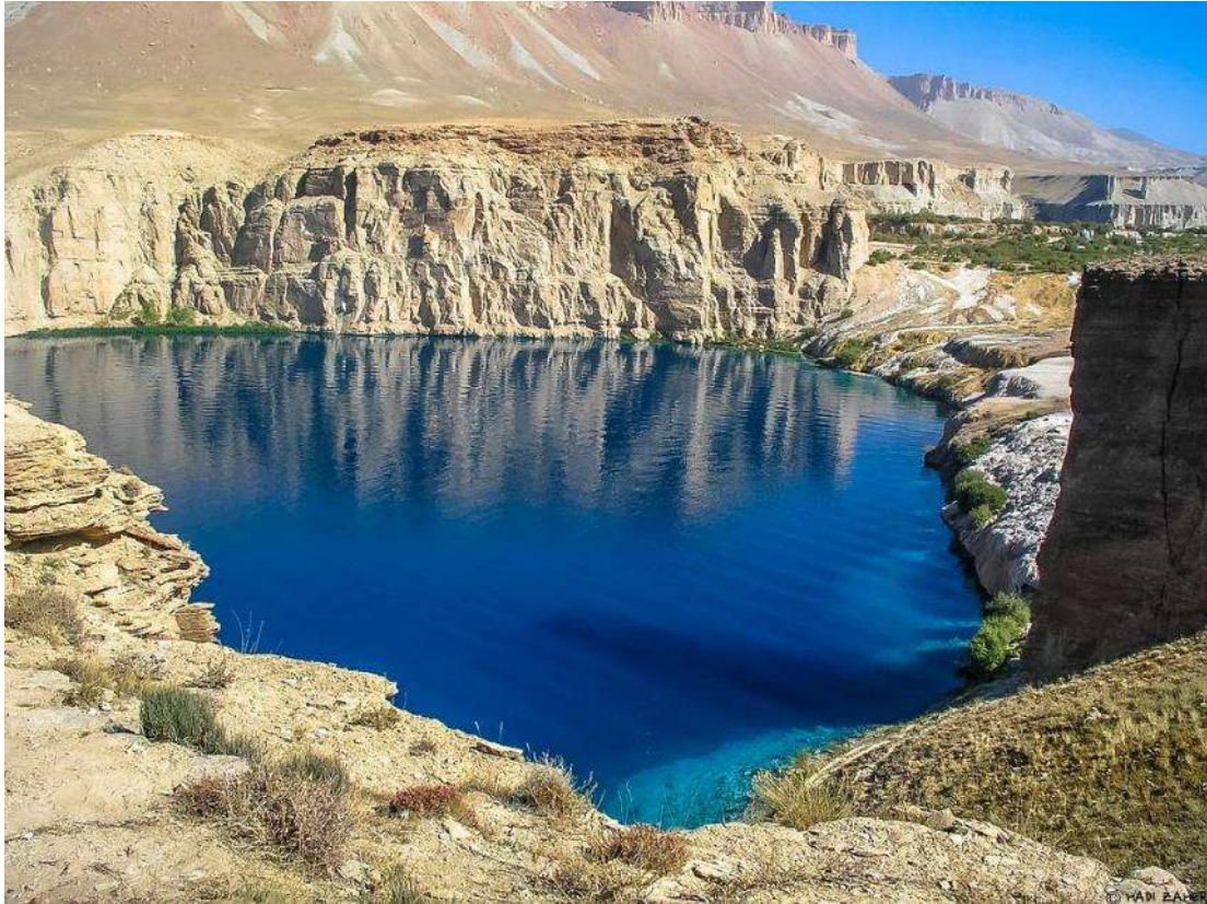
Το Εθνικό Πάρκο των Λιμνών, Μπαντάρ Αμίρ

Στη συνέχεια μας περιμένει ένα από τα πιο απρόσμενα τοπία της Γης. Βαθεία στην έρημο των κεντρικών οροπεδίων αποκαλύπτεται στα μάτια μας το εξωκόσμιο σκηνικό του Μπαντάρ Αμίρ. Οι χρωματιστές λίμνες του Αφγανιστάν. Λίγοι άνθρωποι κατάφεραν να φτάσουν σ' αυτό το σημείο του κόσμου όπου η φύση σμίλεψε απίστευτης ομορφιάς φαράγγια, υψοπλαγιές, τραπεζοειδή βουνά και τα στόλισε με βαθυγάλανες, σκουρόχρωμες και γαλαζοπράσινες λίμνες. Με τις εικόνες του Μπαντάρ Αμίρ στα μάτια μας επιστρέφουμε το απόγευμα στο Μπαμιάν.