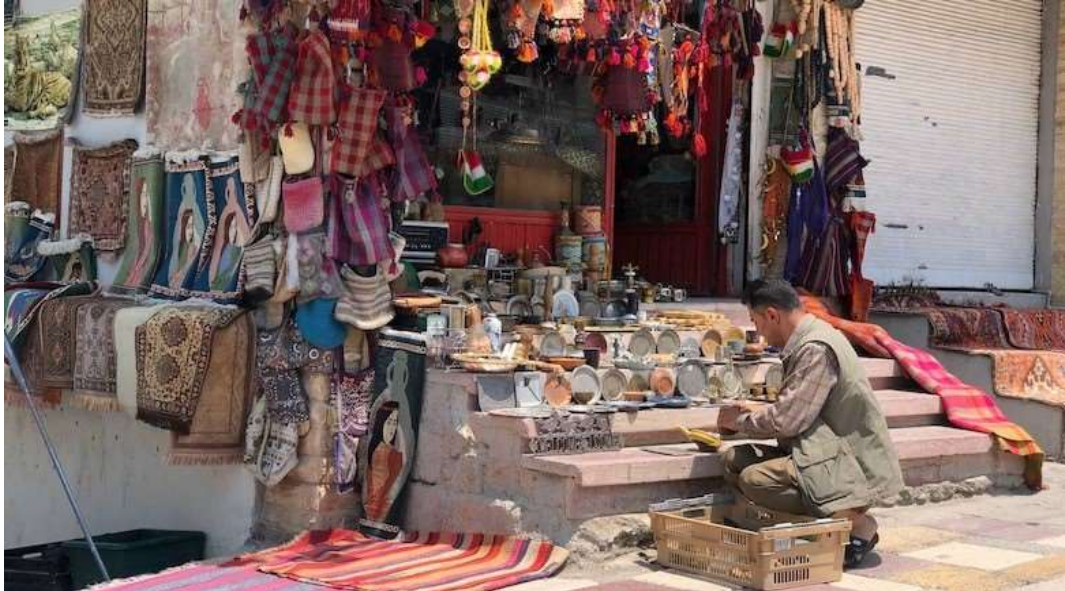
Έμπορος στο παζάρι της Ντοχούκ

Ανήκει στην λεγόμενη Χαλδαϊκή Εκκλησία και στην περίοδο της άνθησης του φιλοξενούσε 600 μοναχούς. Ένα συνεχές ρεύμα Κούρδων και Αράβων χριστιανών συρρέει καθημερινά στους χώρους του μοναστηριού που αναστηλώθηκε με χρήματα του (πλούσιου πλέον) κουρδικού κράτους. Το υπόλοιπο της ημέρας είναι αφιερωμένο στο πολύβουο παζάρι του Ντοχούκ ένα από τα πιο αυθεντικά της Μέσης Ανατολής.