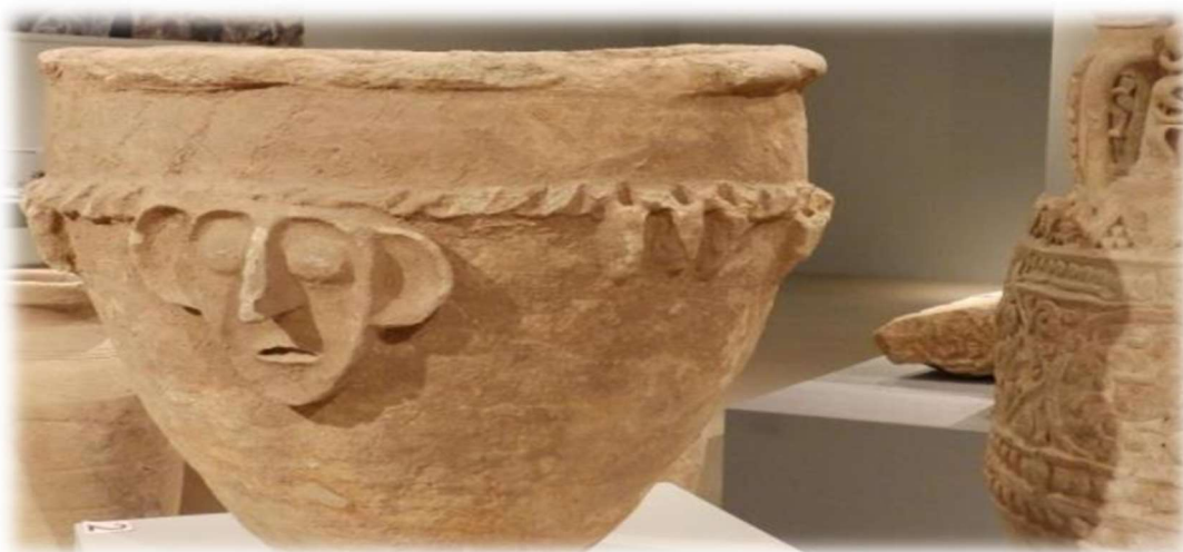
Εκθέματα στο Μουσείο της Σουλεϊμανίγια

Αλλάζουμε σκηνικό σήμερα καθώς διατρέχουμε τις παραλίμνιες περιοχές του Ντουκάν. Ειδυλλιακά πράσινα τοπία και λιβάδια πλαισιώνουν την ορεινή λίμνη του Ντουκάν. Από δω θα κατηφορίσουμε ξανά στις πεδιάδες του Κουρδιστάν. Το μεσημέρι καταλήγουμε στην μοντέρνα Σουλεϊμανίγια την δεύτερη μεγαλύτερη πόλη του Κουρδιστάν. Εδώ θα επισκεφθούμε το μουσείο με αρχαιότητες απ' όλες τις περιόδους της ιστορίας της χώρας. Στη συνέχεια θα περιηγηθούμε το μεγάλο παζάρι που κατακλύζεται από αγαθά από όλο τον κόσμο. Αποχαιρετιστήριο δείπνο με χαρακτηριστική κουρδική κουζίνα.