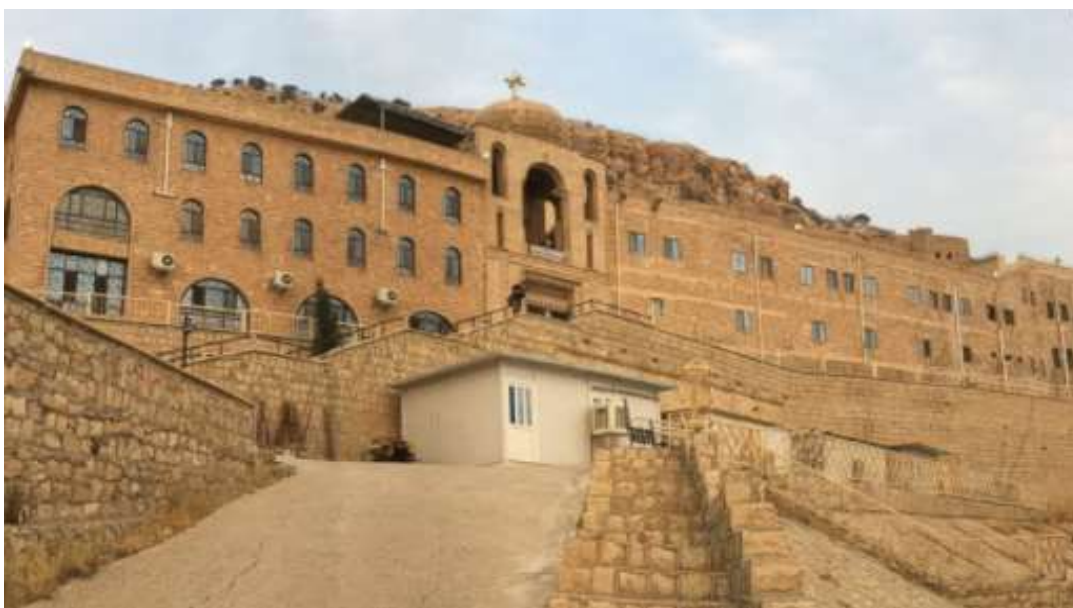
Το Σύρο-ορθόδοξο Μοναστήρι του Αγ. Ματθαίου

Αφήνουμε την πρωτεύουσα και κατευθυνόμαστε στην πεδιάδα του ποταμού Τίγρη. Εδώ θα σταθούμε στο πεδίο της Μάχης των Γαυγαμήλων όπου παίχτηκε η τελευταία πράξη της κατάλυσης του Περσικού Αχαιμενιδικού κράτους από τον Μέγα Αλέξανδρο. Ακολούθησε η φυγή του Δαρείου Γ' και η δολοφονία του από τον Βήσσο. Έτσι ο Αλέξανδρος έγινε κύριος της Περσικής Αυτοκρατορίας. Συνεχίζοντας την εξερεύνηση της Κουρδικής ενδοχώρας θα σταθούμε στο Σύρο-ορθόδοξο μοναστήρι του Αγίου Ματθαίου όπου οι μοναχοί θα μας ξεναγήσουν στους θρησκευτικούς θησαυρούς και τα κειμήλια της Μονής. Καταλήγουμε στην πόλη Ντοχούκ στα βόρεια σύνορα του Κουρδιστάν.