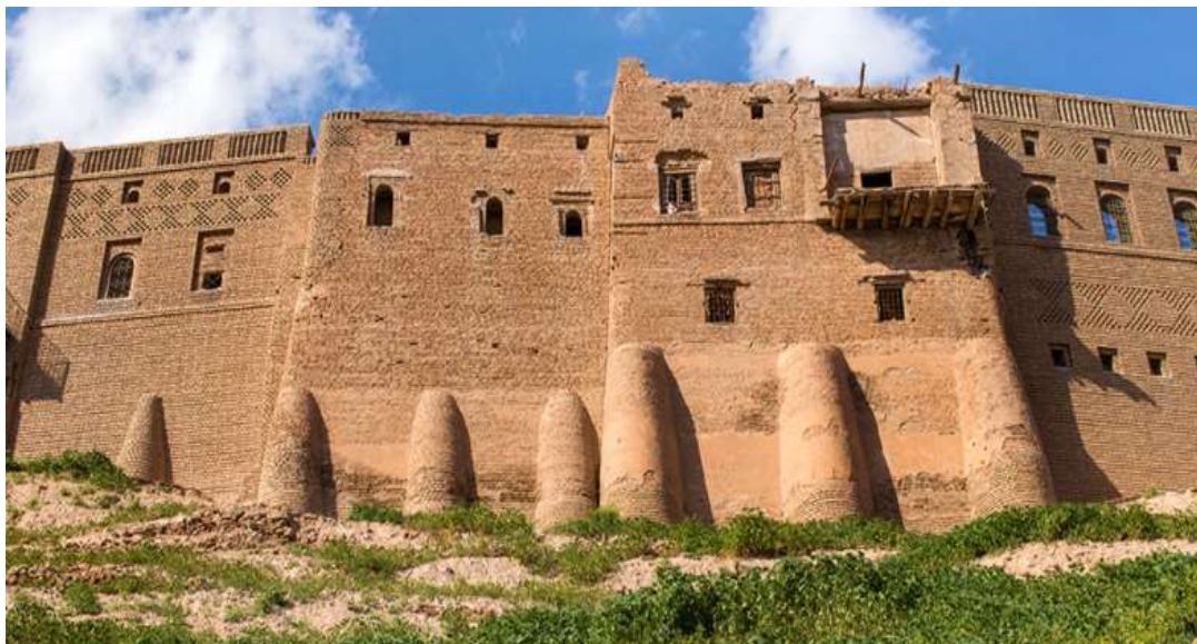
Η Ακρόπολη του Ερμπίλ

Το Ερμπίλ είναι από εκείνες τις παλιές πόλεις της Μέσης Ανατολής που αναζητάει μια νέα ταυτότητα στη σύγχρονη εποχή. Έτσι τα παραδοσιακά παζάρια συνυπάρχουν με τα μοντέρνα γυάλινα κτήρια. Στην ξενάγηση της πόλης θα επικεντρωθούμε στον εντυπωσιακό χώρο της αρχαίας Ακρόπολης Καλάτ Χαουλέρ που χρονολογείται από την περίοδο των Σασσανιδών της Περσικής αυτοκρατορίας.