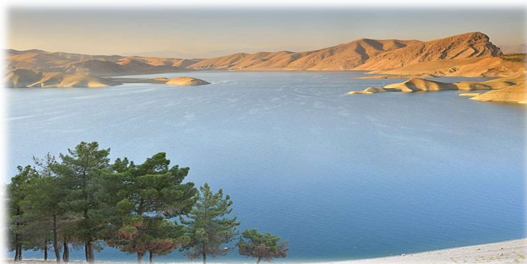
Η ορεινή λίμνη Ντουκάν