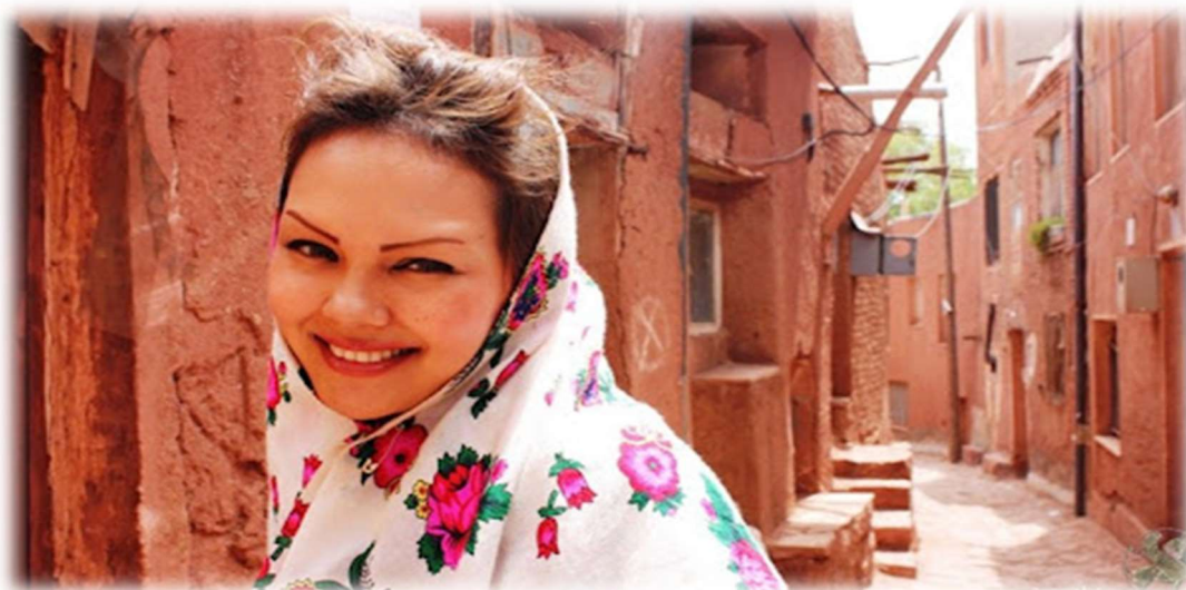
Το χωριό Αμπιανέ

Είναι τόσα πολλά αυτά που έχει να μας αποκαλύψει η σημερινή διαδρομή, που θα ευχόμαστε η μέρα να μην τελειώσει. Μετά το πρωινό αναχωρούμε από την Τεχεράνη. Η αποκάλυψη ωστόσο έρχεται μέσα στα φαράγγια του όρους Κάρκας, όπου ξεπετάγεται μπροστά μας το κοκκινωπό περίγραμμα του χωριού Αμπιανέ, σαν να βγήκε κατευθείαν από την έρημο του Μεξικού τις πλαγιές του Αντιάτλαντα στο νότιο Μαρόκο. Εξαιρετική αρχιτεκτονική, παραδοσιακές φορεσιές και ένα τοπίο φωτογενέστατο που σίγουρα θα μας εντυπωσιάσει.