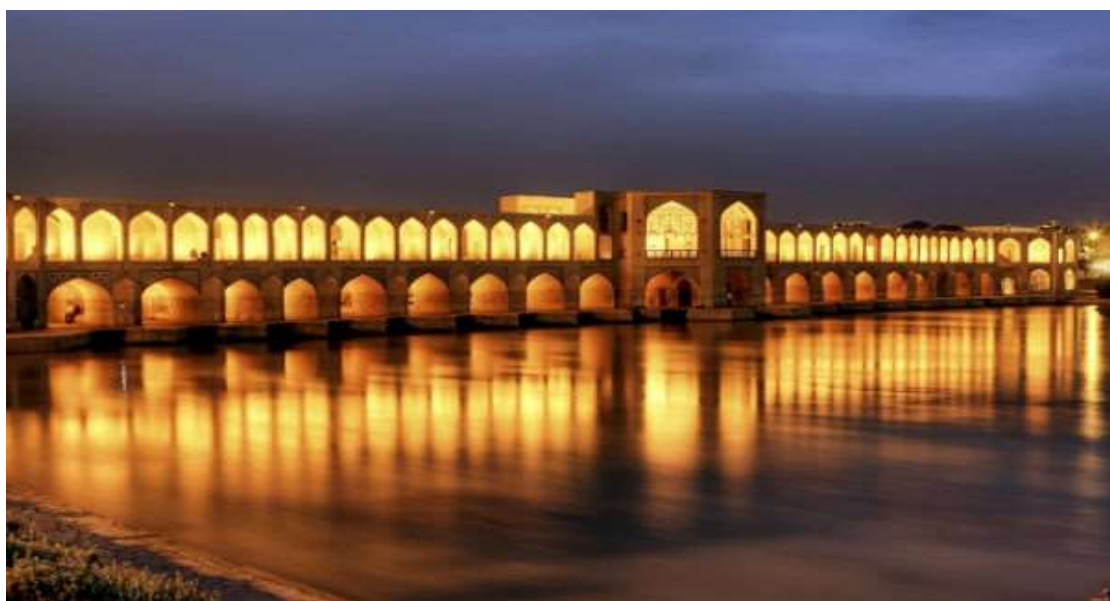
Φωταγωγημένη γέφυρα στο Ισφαχάν

Στη γνωριμία μας με το Ισφαχάν θα αντιληφθούμε ότι πρόκειται για την πιο όμορφη και πιο κοσμοπολίτικη πόλη της χώρας. Εδώ φυσάει ένας αέρας διαφορετικός που καταρρίπτει την έννοια του θεοκρατισμού που χαρακτηρίζει την χώρα και που προκαλεί έκπληξη στον επισκέπτη όταν συγκρίνει την ελευθεριότητα του Ισφαχάν με τον συντηρητισμό που αποπνέουν οι άλλες πόλεις. Η ρήση ότι «το Ισφαχάν είναι ο μισός κόσμος» ειπώθηκε από τον ίδιο τον Σαχ Αμπάς τον 16ο αιώνα, υπονοώντας το μεγαλείο του. Σήμερα θα ξεκινήσουμε τη μέρα μας με ξενάγηση στο ανάκτορο Τσεχέλ Σοτούν με τους υπέροχους κήπους, γνωστό σαν παλάτι των 40 κιόνων ή αλλιώς ως παλάτι του αντικατοπτρισμού. Ακολουθεί επίσκεψη στον Αρμένικο καθεδρικό ναό και στο μουσείο ενώ το απόγευμα θα απολαύσουμε μια βόλτα στις φωταγωγημένες γέφυρες του ποταμού Ζαγιαντί. Θα κλείσουν μια μεγάλη και υπέροχη μέρα!