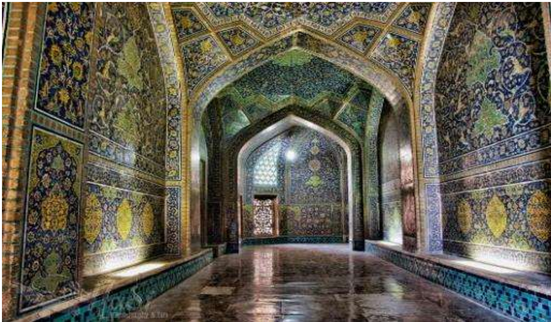
τζαμί του Σείχη Λοτφολάχ

Μια ακόμα υπέροχη μέρα μάς περιμένει. Οι αισθήσεις μας απογειώνονται με την επίσκεψη στο πολύχρωμο τέμενος του Ιμάμη στην βασιλική πλατεία του Ισφαχάν και το γειτονικό τζαμί του Σείχη Λοτφολάχ , που η απουσία μιναρέ αναδεικνύει ακόμη πιο έντονα τη μαγεία των σχεδίων του τρούλου του που θεωρείται ο τρίτος ωραιότερος της Περσίας.