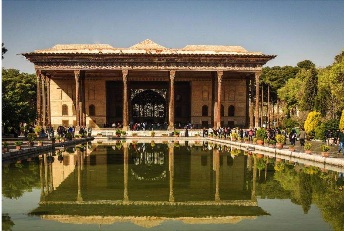
Το Παλάτι των 40 Κιόνων