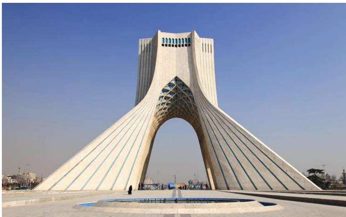
Ο πύργος Αζαντί

Συγκέντρωση στο αεροδρόμιο και πτήση για την Τεχεράνη, την πρωτεύουσα του Ιράν. Άφιξη και μεταφορά στο ξενοδοχείο μας για άμεση παραλαβή δωματίων και διανυκτέρευση.