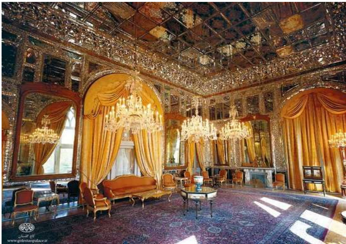
Το παλάτι Γκολεστάν

Ακόμα μία μέρα στην πρωτεύουσα για να φωτογραφήσουμε τον Πύργο Μιλάντ που ολοκληρώθηκε το 2007 και με ύψος 435 μέτρα αποτελεί σήμερα το Διεθνές Συνεδριακό και Εμπορικό Κέντρο της Τεχεράνης. Στη συνέχεια θα ξεναγηθούμε στο παλάτι Νιαβαράν ένα σύμπλεγμα ανακτόρων του 18 ου αλλά και του 20 ου αιώνα ενώ η μέρα μας θα ολοκληρωθεί με την επίσκεψη στο υπέροχο Παλάτι Γκολεστάν , την κατοικία του τελευταίου Σάχη της Περσίας Παχλεβί.