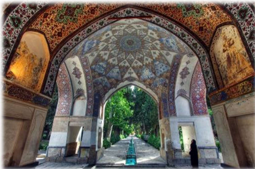
Αρχοντικό στο Κασάν

Στη συνέχεια θα σταθούμε στο Κασάν, στις παρυφές της Μεγάλης Ερήμου, φημισμένο για τους κήπους Φιν και τα πλούσια αρχοντικά των εμπόρων του παρελθόντος που αποτελούν εξαιρετα δείγματα ιρανικής αστικής αρχιτεκτονικής του 19ου αιώνα.