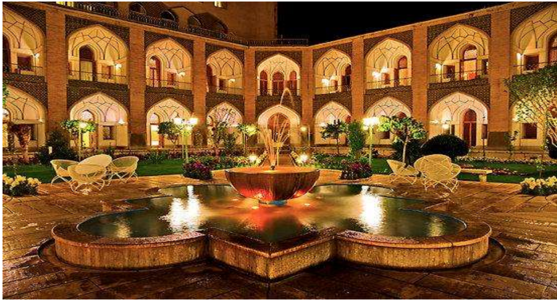
Ο κήπος του ξενοδοχείου μας

Αργά το απόγευμα προσεγγίζουμε το αριστοκρατικό Ισφαχάν και καταλήγουμε στο ξενοδοχείο - παλάτι που θα μας φιλοξενήσει απόψε, το μαγικό Αμπασί.