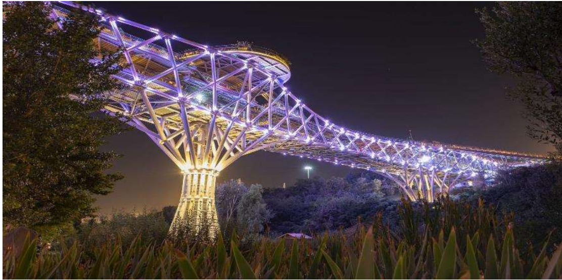
Η γέφυρα Ταμπιάτ

συλλογή που σίγουρα θα σας εντυπωσιάσει! Η μέρα μας θα κλείσει με βόλτα στην μοντέρνα γέφυρα Ταμπιάτ που ενώνει δύο από τους σημαντικότερους πνεύμονες πρασίνου της Τεχεράνης.