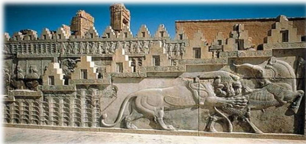
Το Ανάκτορο Απαντάνα στην Περσέπολη

Σήμερα επισκεπτόμαστε το Νακς-ε-Ροστάμ , μια κάθετη βραχώδη πλαγιά στην οποία λαξεύτηκαν οι τάφοι του Δαρείου Α', του Ξέρξη, του Αρταξέρξη, του Δαρείου Β' και της συζύγου του Παρεισάτιδος. Όλη η ιστορία της Περσίας περνά μπροστά από τα μάτια μας στην θέα αυτών των μεγαλόπρεπων ταφικών συγκροτημάτων. Επόμενος σταθμός μας το σπουδαιότερο αξιοθέατο του ταξιδιού μας το Takht-e Jamshid που δεν είναι άλλο από την θρυλική Περσέπολη , την αρχαία πρωτεύουσα της δυναστείας των Αχαιμενιδών.