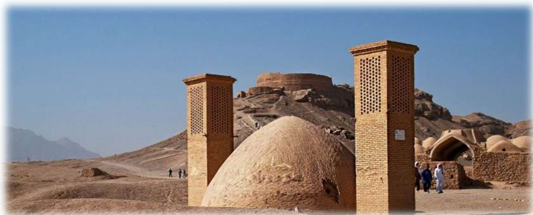
Οι Πύργοι της Σιωπής στο Γιαζντ

Νωρίς το πρωί ξεκινάμε για το Γιαζντ. Καθοδόν θα έχουμε την ευκαιρία να απολαύσουμε το κάστρο Ναρίν, θα σταθούμε στα καραβάν σεράι της Μείμπόντ και του Φαχράζ και θα δούμε ένα ιδιόμορφο «ψυγείο» της ερήμου! Πλησιάζοντας στο Γιαζντ θα σταθούμε να ατενίσουμε τους Πύργους της Σιωπής , τον χώρο όπου μέχρι το 1950 τοποθετούνταν οι νεκροί των Ζωροαστρών προκειμένου να φαγωθούν από τα όρνια, όπως επέβαλε η παράδοση. Κορυφαίο αξιοθέατο της σημερινής μέρας η επίσκεψη στο ναό των Ζωροαστρών . Πρόκειται για μια λιτή κατασκευή που τη στολίζουν τα σύμβολα του Θεού Άχουρα Μάζντα, ενώ στο χώρο φυλάσσεται και η άσβεστη Φλόγα. Συνεχίζουμε τη γνωριμία μας με την μεσαιωνική Γιαζντ, γνωστή και ως «Η Ευγενής Πόλη Της Ερήμου». Θα ξεναγηθούμε στη μαγική καλοδιατηρημένη παλιά πόλη , χτισμένη από πηλό που είναι ένα αριστούργημα αρχιτεκτονικής. Ένας λαβύρινθος από στενούς δρόμους και κάπου στον ορίζοντα να δεσπόζουν οι πύργοι των ανέμων , ευφύεστατες κατασκευές για την διατήρηση της θερμοκρασίας σε χαμηλά επίπεδα κατά την διάρκεια του ζεστού καλοκαιριού.