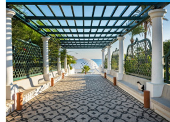
Οι Θέρμες Καλλιθέας

Στην τιμή της εκδρομής μας συμπεριλαμβάνεται η κρουαζιέρα στο Καστελόριζο!