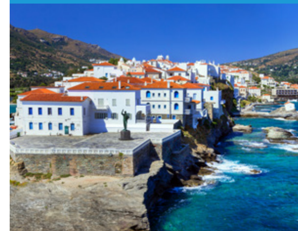
Η πλατεία της Ρίβας στη Χώρα της Άνδρου.

Την φρουτάλια (τοπική ομελέτα), τα γλυκά καλτσούνια με μέλι και καρύδια, τα παστιτσάκια (αμυγδαλωτά), παραδοσιακά ζυμαρικά, γλυκά του κουταλιού και τα ντόπια τυριά.