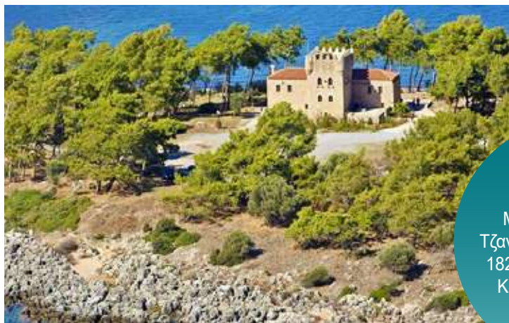
Ο παραδοσιακός Μανιάτικος Πύργος Τζανετάκη, κοσμή από το 1829 το γραφικό νησάκι Κρανάνη του Γυθείου.

αρχαίας Καινήπολης. Κατευθυνόμενοι για το ακρωτήριο Ταίναρο θα διακρίνουμε τα αρχαία λατομεία μαρμάρων. Είναι ο τόπος των μύθων της αρχαίας Λακωνίας, με το ιερό του νεκρομαντείου του Ποσειδώνα και του ψυχοπομπίου - καθόδου στον Άδη. Εδώ θα δούμε και το περίφημο ψηφιδωτό "Άστρο της Αριάς" στα ερείπια αρχαίας έπαυλης. Συνεχίζουμε για την πυργούπολη της Βάθειας, το κατ' εξοχήν σύμβολο και πιο διάσημο οχυρωμένο οικισμό της Μάνης. Αργότερα θα έχουμε χρόνο για γεύμα στον ειδυλλιακό Γερολιμένα με το μαγευτικό παραθαλάσσιο σκηνικό και μετά θα περπατήσουμε στον οικισμό της Κοίτας της "Πολυπυργούς", ανάμεσα στα πάμπολλα πυργόσπιτα για να πάρουμε την αίσθηση της νοστορπίας και της ιστορίας του τόπου. Επιστρέφουμε στο ξενοδοχείο μας. Το βράδυ δείπνο.