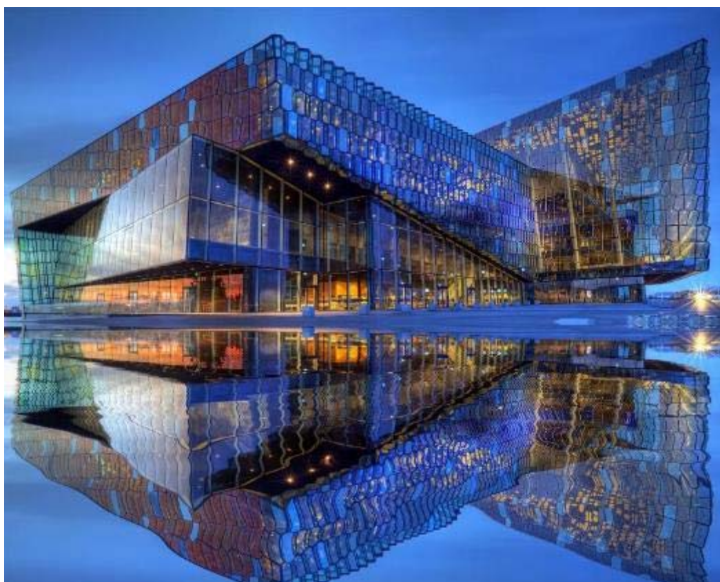
Το φουτουριστικό Harpa Concert Hall στο λιμάνι της πόλης

Συγκέντρωση στο αεροδρόμιο και πτήση για το Ρέικιαβικ μέσω ενδιάμεσου σταθμού. Το διεθνές αεροδρόμιο της πόλης βρίσκεται στην χερσόνησο του Ρέικιανες, μια περιοχή σχεδόν σεληνιακού τοπίου, καλυμμένη από λάβα. Το γυμνό, απόκοσμο τοπίο δίνει τη θέση του στα προάστεια της πρωτεύουσας όπου κυριαρχούν κτίρια γραφείων μεγάλων εταιριών με μοντέρνα αρχιτεκτονική. Στην ευρύτερη περιοχή της πρωτεύουσας ζει σήμερα το 70% του πληθυσμού της χώρας! Όμως η πρωτεύουσα η «μεγαλύτερη μικρή πόλη του κόσμου», όπως την αποκαλούν οι ίδιοι και η βορειότερη πρωτεύουσα του Κόσμου, διατηρεί τον «επαρχιακό» της χαρακτήρα –κυρίως στο κέντρο της πόλης– ενώ κοσμείται από αρχιτεκτονικά ενδιαφέροντα κτίρια όπως το καινούργιο κτίριο της Όπερας στο λιμάνι, το παλιό Πολιτιστικό Κέντρο και τις ιστορικές οικίες στην ανακαινισμένη προκυμαία της.