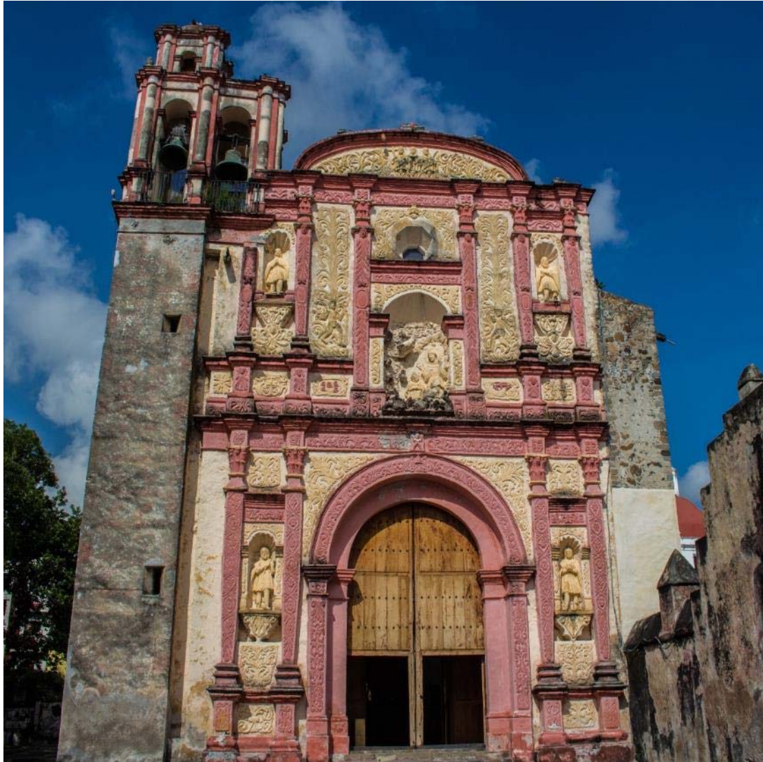
Ο Καθεδρικός στη Γκουαρνεβάκα

Κάτι λιγότερο από 100 χιλιόμετρα νοτιοδυτικά της πρωτεύουσας, στην επαρχία Μορέλος, βρίσκεται η πόλη της αιώνιας άνοιξης, η Γκουαρνεβάκα ή πόλη των δένδρων όπως την αποκαλούσαν οι ιθαγενείς Ναχουάτι. Ο Καθεδρικός ναός της που φιλοξένησε την πρώτη ιεραποστολή το 1552 είναι ένα πραγματικό κόσμημα! Αφού θαυμάσουμε τους αρχιτεκτονικούς θησαυρούς αιώνων συνεχίζουμε για το Τάξκο, την πόλη του Ασημιού!