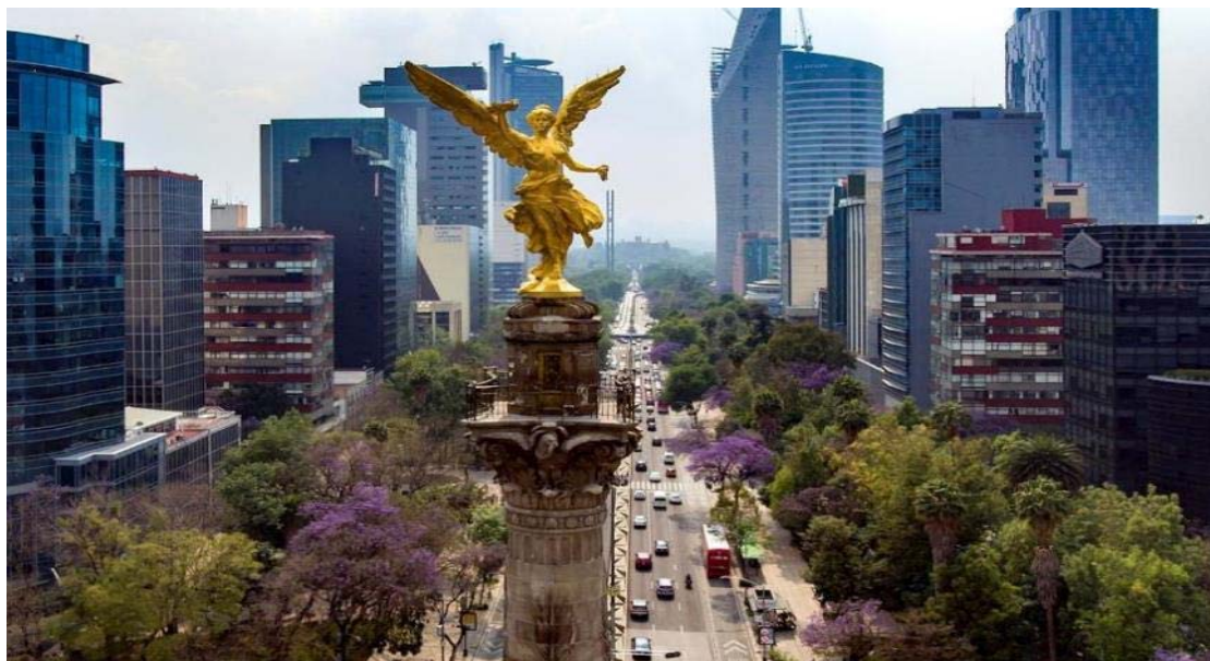
Paseo de la Reforma, Mexico City

Αναχώρηση για το Μέξικο Σίτυ, την πρωτεύουσα της χώρας και μεγαλύτερο αστικό κέντρο του κόσμου με 25 εκατομμύρια ανθρώπους! Μεγάλη, χαοτική αλλά και όμορφη, χτισμένη στα 2.250 μέτρα εκεί που κάποτε υπήρχε μια λίμνη! Εκεί που κάποτε οι Αζτέκοι είχαν μεγαλοουργήσει. Εκεί που η ιστορία μπλέκεται με τον μύθο. Αυτές τις κρυμμένες ομορφιές θα ανακαλύψουμε στο μεστό πρόγραμμα που ακολουθεί.