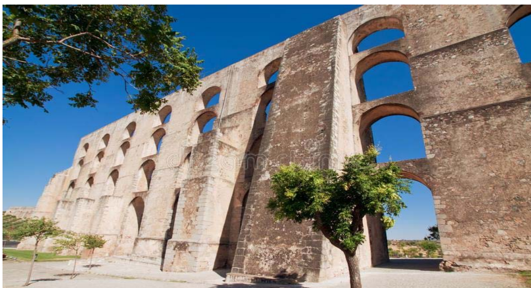
Το υδραγωγείο του Κερέταρο

Το Μεξικό είναι γεμάτο πολιτιστικούς θησαυρούς κι ένας από αυτούς είναι και η πόλη του Κερέταρο, μνημείο πολιτιστική κληρονομιάς της UNESCO!!! Φυσικά θα την επισκεφθούμε, θα δούμε το θαυμάσιο υδραγωγείο της, το θέατρο και το ιστορικό της κέντρο με την Plaza de la Corregidora.