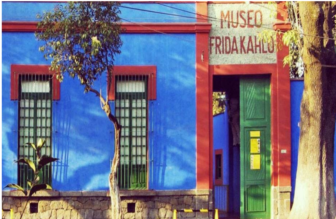
Το σπίτι της Φρίντα Κάλο

Στη συνέχεια μας περιμένει μια κρουαζιέρα στα κανάλια του Χοτσιμίλκο που βρίσκονται στην νοτιοανατολική πλευρά της πρωτεύουσας. Εξάλλου όπως έχουμε πει ολόκληρη η πόλη του Μεξικό είναι χτισμένη πάνω σε μια λίμνη! Τα κανάλια είναι ό,τι απόμεινε από την αποξήρανση της λίμνης ενώ η υποχώρηση του νερού δημιούργησε μικρά τεχνητά νησάκια που σήμερα ονομάζονται τσινάμπας! Κι επειδή οι Μεξικάνοι έχουν τη χαρά της ζωής στο αίμα τους, εδώ στο Χοτσιμίλκο, μέσα σε πολύχρωμες βάρκες τραγουδούν με τα σομπρέρος τους και τις πολύχρωμες φορεσιές τους, βάσανα κι αγάπες σε μελωδικούς σκοπούς! Με μια τέτοια «κρουαζιέρα» με συνοδεία μουσικής θα αποχαιρετήσουμε το Μεξικό. Το βράδυ γεμάτοι εικόνες θα επιβιβαστούμε στο αεροπλάνο όπου μέσω ενδιάμεσου σταθμού θα επιστρέψουμε στην Ελλάδα.