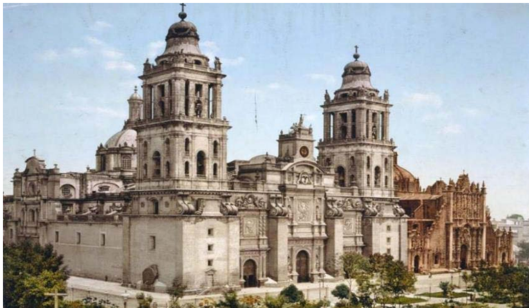
Ο καθεδρικός Ναός της πόλης του Μεξικό

Το " Paseo de la Reforma ", η εντυπωσιακή λεωφόρος με το χρυσό άγαλμα του Αγγέλου της Ανεξαρτησίας και τις προτομές των πλέον διάσημων προσωπικοτήτων της χώρας, η θορυβώδης πλατεία των μουσικών "Μαριάτσι", ο πανύψηλος πύργος " Torre Latinoamericana " και η ζωντανή περιοχή της " Zona Rosa ", με τα πιο φημισμένα bar, clubs και μοντέρνα καταστήματα θα συμβάλλουν στη γνωριμία μας με την άκρως ενδιαφέρουσα μεξικανική μεγαλούπολη.