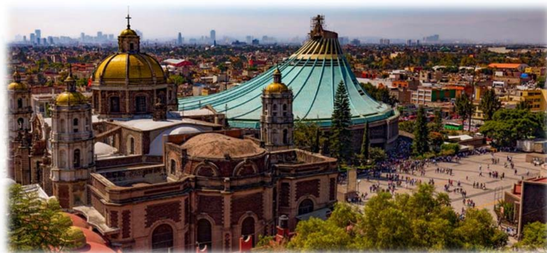
Η παναγία της Γουαδελούπης

Σήμερα αναχωρούμε για τα περίχωρα του Μέξικο Σίτυ, με πρώτη στάση στην παγκοσμίως διάσημη εκκλησία της Παναγίας της Γουαδελούπης, το σημαντικότερο προσκύνημα του καθολικού κόσμου της αμερικανικής ηπείρου. Οι τέσσερις εμφανίσεις της "Virgen Morena" (Μελαχρινή Παρθένα) στον Ινδιάνο Χουάν Ντιέγκο, αποτελούν την αιτία κατασκευής τής εν λόγω μεγαλόπρεπτης βασιλικής, όπου φυλάσσεται το "tilma" (μανδύας από ίνες "agate", ένα χοντρό ύφασμα κατασκευασμένο από φύλλα κάκτου) και η θαυματουργή εικόνα της Μαύρης Παναγίας.