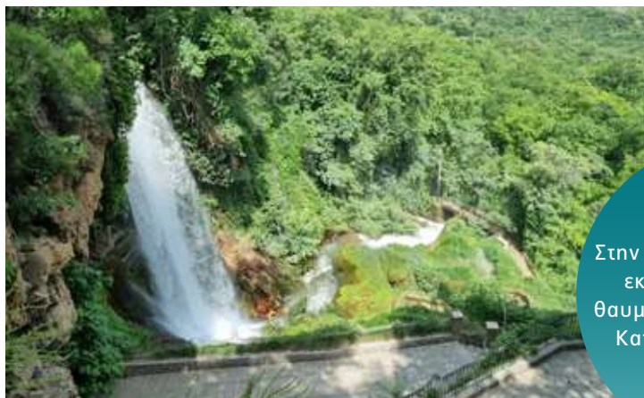
Στην καταπράσινη Έδεσσα, εκτός των άλλων, θα θαυμάσουμε τον περίφημο Καταρράκτη "Κάρανο"

Πλούσιο μπουφέ πρόγευμα και επίσκεψη στην ιστορική γραμμή οχυρών Μεταξά - Ιστίμπεη, ακολουθώντας τη διαδρομή προς Προμαχώνα - Ρούπελ. Ξενάγηση στο Στρατιωτικό Μουσείο με τα πολλά κειμήλια από την περιοχή και σε τμήμα των Οχυρών. Συνεχίζουμε προς τη λίμνη Κερκίνη, έναν από τους σημαντικότερους υδροβιότοπους της Ευρώπης, με είδη σπάνιας χλωρίδας και πανίδας. Ενημέρωση από την ειδική ομάδα και χρόνος για γεύμα στην τοπική χαρακτηριστική ταβέρνα. Ευκαιρία να δοκιμάσουμε τις τοπικές σπεσιαλιτέ όπως βουβάλη, ζαρκάδι, αγριογούρουνο, αρνάκι γάστρας κ.α. Για όσους επιθυμούν, βαρκάδα (έξοδα ατομικά) κοντά στις όχθες. Τελευταίος μας σταθμός για σήμερα θα είναι τα Άνω Πορρόια, χωριό πανέμορφο και γραφικό, κατάφυτο με τρεχούμενα νερά και υπέροχη θέα στη λίμνη όπου χρόνος