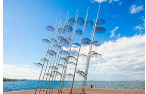
Το εμβληματικό σύγχρονο γλυπτό του Γιώργου Ζογγολόπουλου "Ομπρέλες" στην παραλία.

Σημείωση: Η 4ήμερη εκδρομή δεν περιλαμβάνει το πρόγραμμα της 4ης μέρας (Ρούπελ-Κερκίνη)