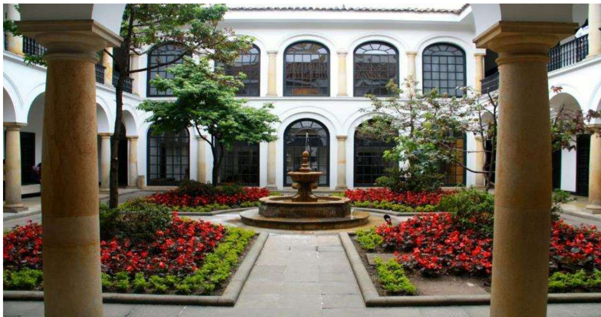
Το μουσείο Μποτόρο