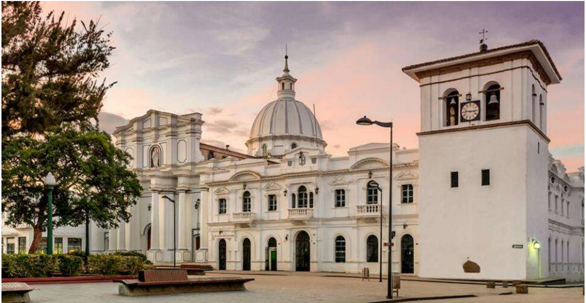
Ποπαγιάν, η Λευκή πόλη

Μετά το πρωινό πετάμε πίσω στο οροπέδιο και από το αεροδρόμιο του Κάλι συνεχίζουμε οδικώς για μία από τις ωραιότερες πόλεις της Κολομβίας, το Ποπαγιάν. Στην απογευματινή ξενάγηση θα εξερευνήσουμε το "λευκό μαργαριτάρι" της αποικιακής αρχιτεκτονικής, και άλλοτε εμπορικό σταθμό μεταξύ Καρταγένας και Κίτο. Παρά τον καταστροφικό σεισμό του 1983 η πόλη επούλωσε γρήγορα τις πληγές της και δείχνει όπως το 1537, όταν ιδρύθηκε από τον Σεμπάστιαν Μπελακάθαρ. Ανάμεσα στα αξιοθέατα θα δούμε την εκκλησία του Σάντο Ντομίνγκο και τα αποικιακά μέγαρα που στολίζουν την πόλη.