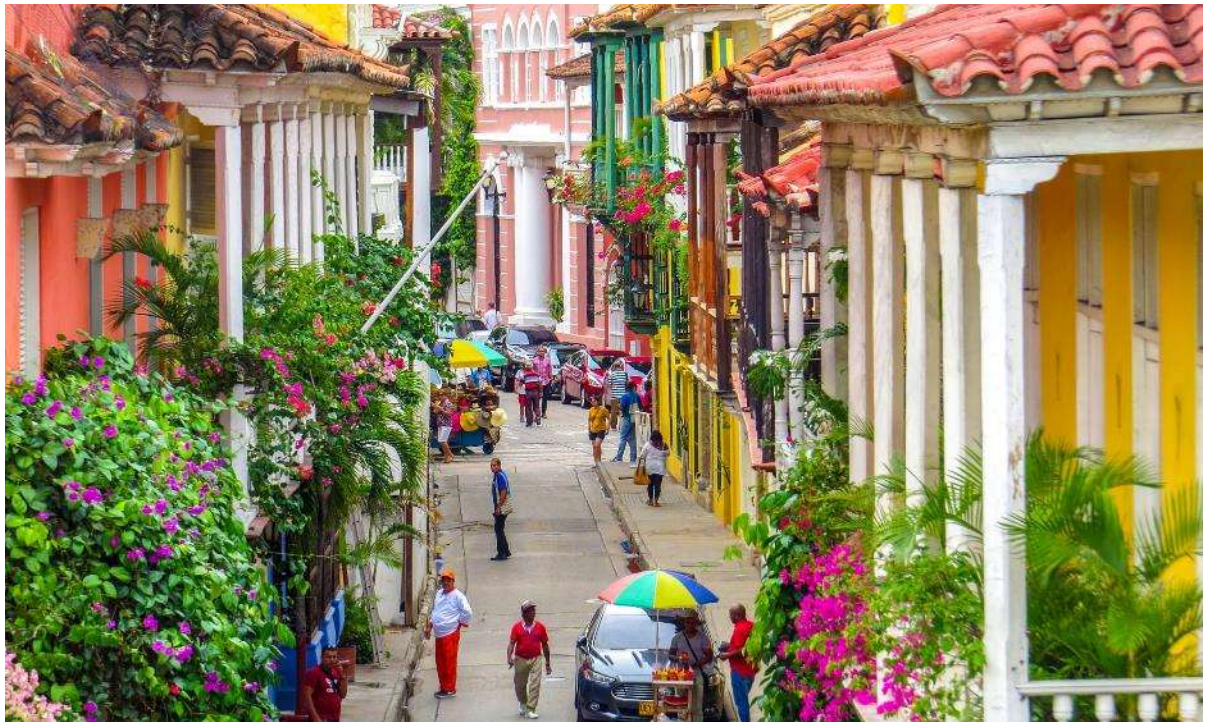
Πολύχρωμα αρχοντικά στην παλιά πόλη