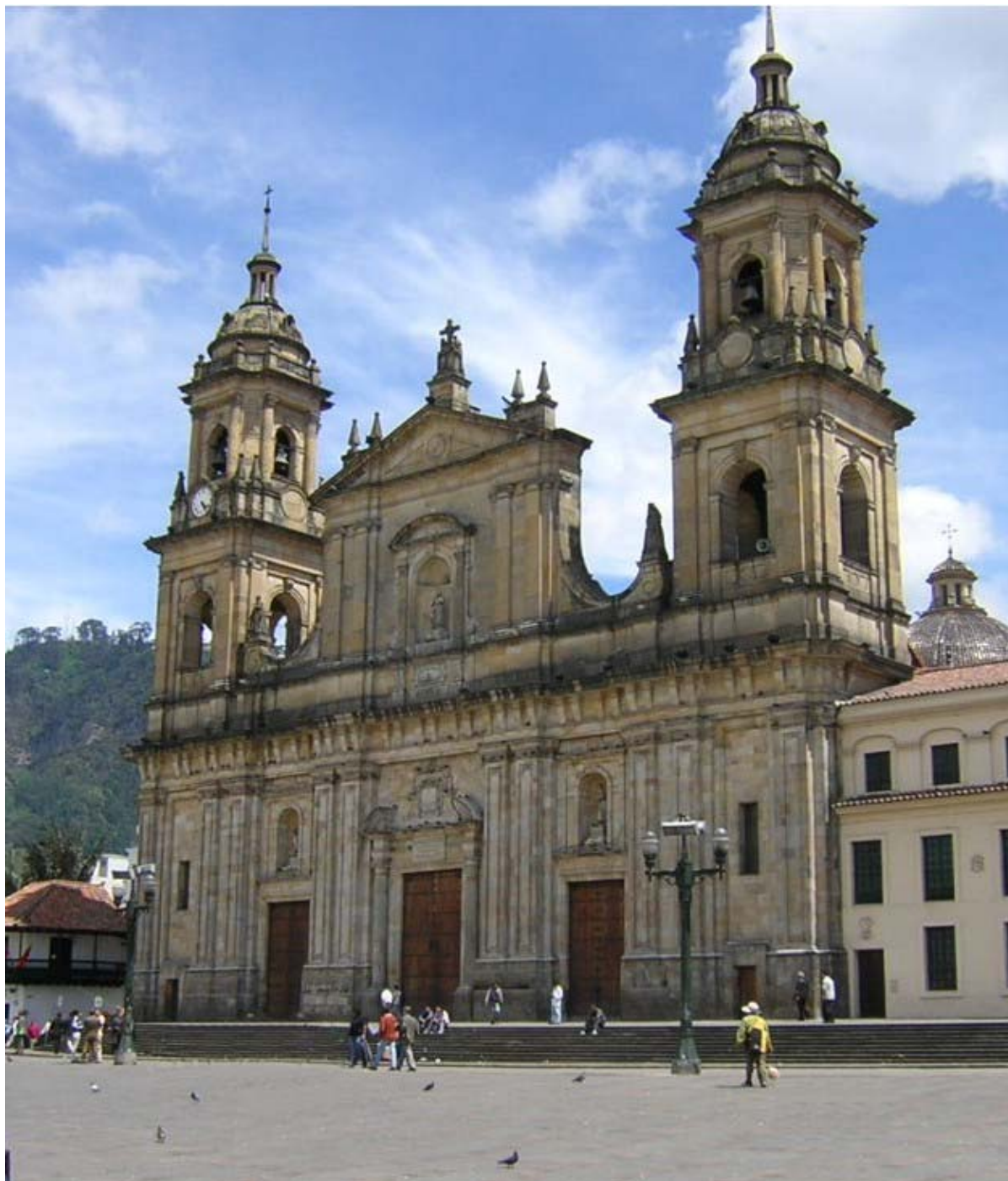
Ο καθεδρικός Ναός της πόλης

Έχοντας απολαύσει μία από τις σημαντικότερες αρχαιολογικές περιοχές προκολομβιανής τέχνης της Λατινικής Αμερικής, αναχωρούμε για το αεροδρόμιο της πόλης Νείβα για μία σύντομη πτήση πίσω στην Μποκοτά. Αφιξη και μεταφορά στο ξενοδοχείο μας για δείπνο και διανυκτέρευση.