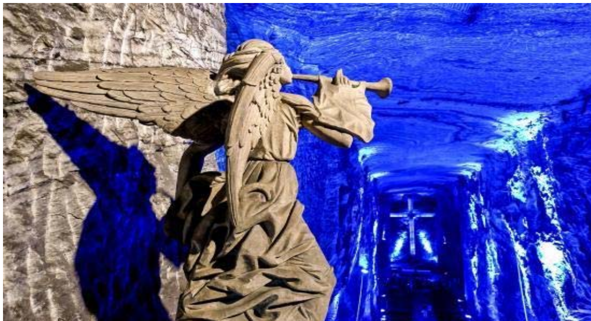
Το εσωτερικό του Ναού στα ορυχεία της Ζιπακίρα

Μετά το πρωινό αφήνουμε την πρωτεύουσα και ξεκινάμε για την επίσκεψη στα θεαματικά ορυχεία της Ζιπακίρα που δημιουργήθηκε 25 εκ. χρόνια πριν. Το θαύμα όμως των ορυχείων είναι μία υπόγεια «τρίκλιτη» ρωμαιοκαθολική εκκλησία , ο Καθεδρικός Ναός όπως ονομάζεται, χωρητικότητας 8.000 ατόμων! Θα εντυπωσιαστείτε!!!