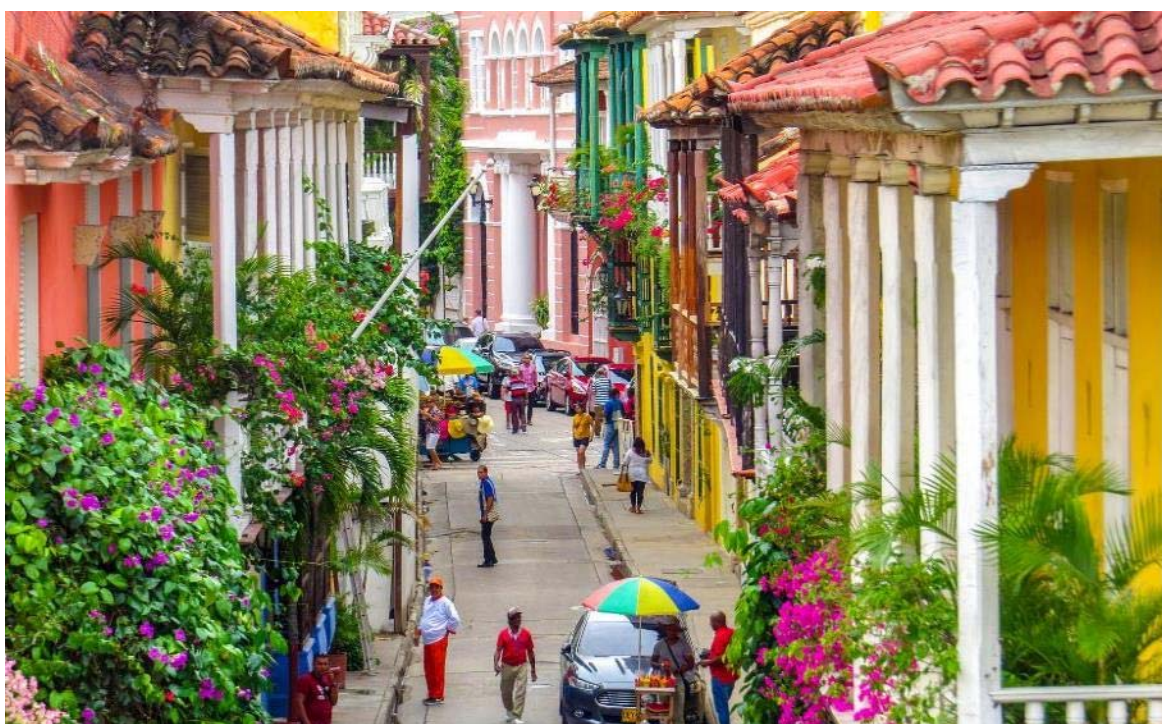
Πολύχρωμα αρχοντικά στην παλιά πόλη