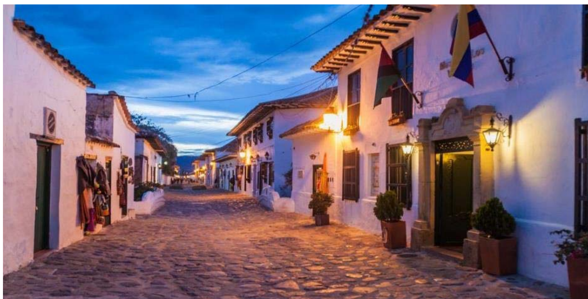
Πλακόστρωτα σοκάκια στη Βίλα Ντε Λείβα

Μετά την ξενάγηση στα έγκατα της γης αναχωρούμε για τη Βίλα ντε Λείβα , ένα κομψοτέχνημα αποικιακής αρχιτεκτονικής που χρονολογείται από το 1572. Το ίδιο απόγευμα θα ξεναγηθούμε στην Πλάζα Μαγιόρ, την μεγαλύτερη πλακόστρωτη πλατεία της Κολομβίας , θα δούμε τα κέντρα χειροτεχνίας και θα γευθούμε την αύρα της παλιάς αποικιακής Κολομβίας. Η διανυκτέρευση στην πόλη είναι μια αποκάλυψη. Μην παραλείψετε να γευθείτε ζεστή πικάντικη σοκολάτα σε κάποια από τα καφέ της κεντρικής πλατείας.