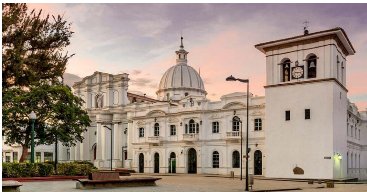
Ποπαγιάν, η Λευκή πόλη

Μετά το πρωινό πετάμε πίσω στο οροπέδιο και από το αεροδρόμιο του Κάλι συνεχίζουμε οδικώς για μία από τις ωραιότερες πόλεις της Κολομβίας, το Ποπαγιάν. Στην απογευματινή ξενάγηση θα εξερευνήσουμε το "λευκό μαργαριτάρι" της αποικιακής αρχιτεκτονικής, και άλλοτε εμπορικό σταθμό μεταξύ Καρταγένας και Κίτο. Παρά τον καταστροφικό σεισμό του 1983 η πόλη επούλωσε γρήγορα τις πληγές της και δείχνει όπως το 1537, όταν ιδρύθηκε από τον Σεμπάστιαν Μπελακάθαρ. Ανάμεσα στα αξιοθέατα θα δούμε την εκκλησία του Σάντο Ντομίνγκο και τα αποικιακά μέγαρα που στολίζουν την πόλη.