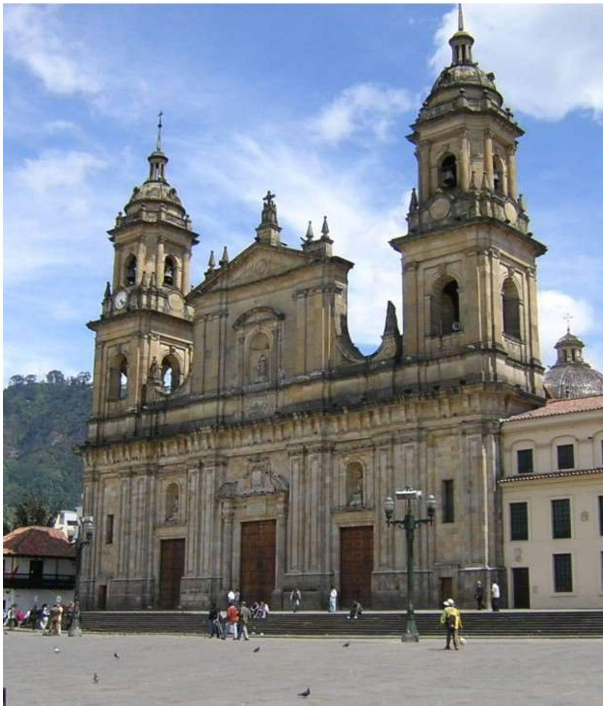
Ο καθεδρικός Ναός της πόλης

Έχοντας απολαύσει μία από τις σημαντικότερες αρχαιολογικές περιοχές προκολομβιανής τέχνης της Λατινικής Αμερικής, αναχωρούμε για το αεροδρόμιο της πόλης Νείβα για μία σύντομη πτήση πίσω στην Μποκοτά. Αφιξη και μεταφορά στο ξενοδοχείο μας για δείπνο και διανυκτέρευση.