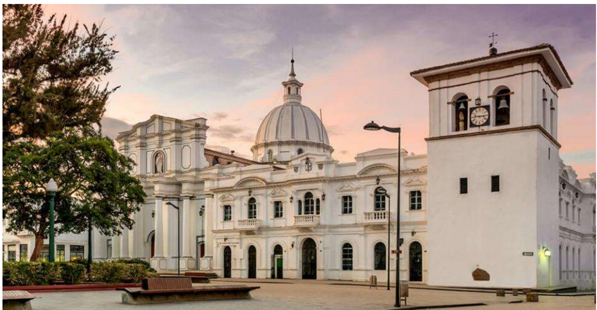
Ποπαγιάν, η Λευκή πόλη

Μετά το πρωινό πετάμε πίσω στο οροπέδιο και από το αεροδρόμιο του Κάλι συνεχίζουμε οδικώς για μία από τις ωραιότερες πόλεις της Κολομβίας, το Ποπαγιάν. Στην απογευματινή ξενάγηση θα εξερευνήσουμε το "λευκό μαργαριτάρι" της αποικιακής αρχιτεκτονικής, και άλλοτε εμπορικό σταθμό μεταξύ Καρταγένας και Κίτο. Παρά τον καταστροφικό σεισμό του 1983 η πόλη επούλωσε γρήγορα τις πληγές της και δείχνει όπως το 1537, όταν ιδρύθηκε από τον Σεμπάστιαν Μπελακάθαρ. Ανάμεσα στα αξιοθέατα θα δούμε την εκκλησία του Σάντο Ντομίνγκο και τα αποικιακά μέγαρα που στολίζουν την πόλη.