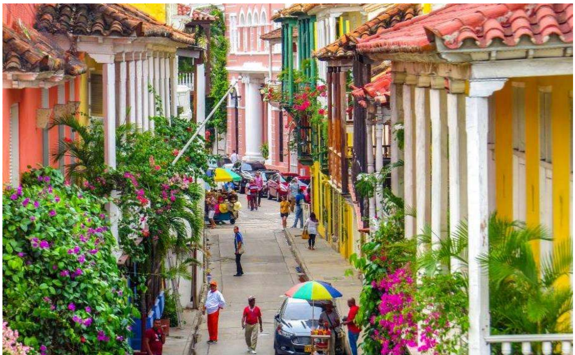
Πολύχρωμα αρχοντικά στην παλιά πόλη