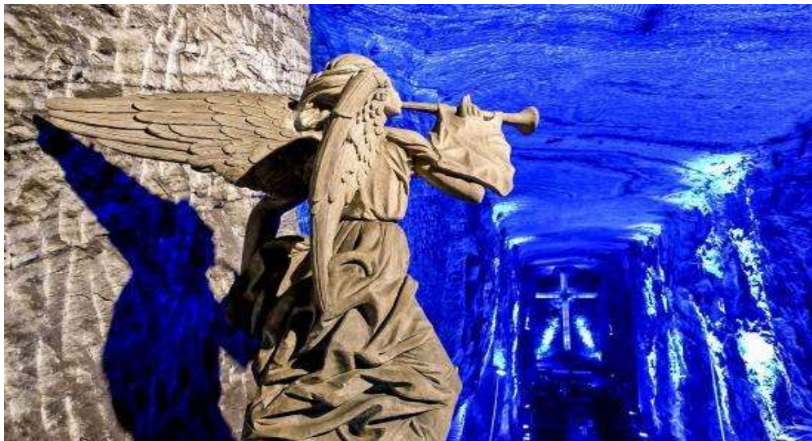
Το εσωτερικό του Ναού στα ορυχεία της Ζιπακίρα

Μετά το πρωινό αφήνουμε την πρωτεύουσα και ξεκινάμε για την επίσκεψη στα θεαματικά ορυχεία της Ζιπακίρα που δημιουργήθηκε 25 εκ. χρόνια πριν. Το θαύμα όμως των ορυχείων είναι μία υπόγεια «τρίκλιτη» ρωμαιοκαθολική εκκλησία , ο Καθεδρικός Ναός όπως ονομάζεται, χωρητικότητας 8.000 ατόμων! Θα εντυπωσιαστείτε!!!