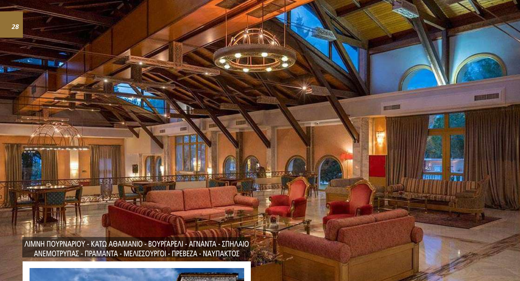
ΛΙΜΝΗ ΠΟΥΡΝΑΡΙΟΥ - ΚΑΤΩ ΑΘΑΜΑΝΙΟ - ΒΟΥΡΓΑΡΕΛΙ - ΑΓΝΑΝΤΑ - ΣΠΗΛΛΑΙΟ ΑΝΕΜΟΤΡΥΠΑΣ - ΠΡΑΜΑΝΤΑ - ΜΕΛΙΣΣΟΥΡΓΟΙ - ΠΡΕΒΕΖΑ - ΝΑΥΠΑΚΤΟΣ