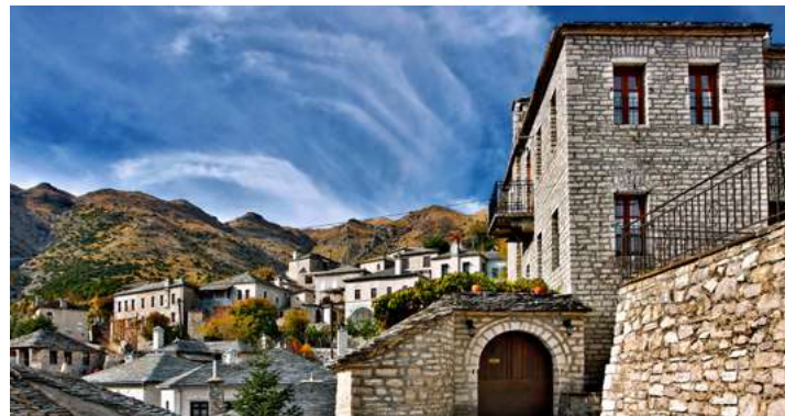
1η μέρα: Αθήνα - Λίμνη Πουρναρίου - Κάτω Αθαμάνιο Βουργαρέλι - Άρτα

Αναχώρηση 07.05 από Αθήνα με ενδιάμεσες στάσεις και μέσω της γέφυρας Ρίου-Αντάρριου. Περνώντας από το χωριό Πέτα, όπου έγινε η ιστορική μάχη με τους Τούρκους τον Ιούλιο του 1822, φτάνουμε στις Μελλάτες, για να θαυμάσουμε το υπέροχο θέαμα της τεκτονικής Λίμνης Πουρναρίου. Συνεχίζουμε με διαδρομή στο κάτω Αθαμάνιο. Στο Παλαιοκάτουνο θα επισκεφθούμε την Κόκκινη εκκλησία (13ου αι) που έχει πάρει το όνομα της από το χαρακτηριστικό κόκκινο χρώμα των πλίνθων της τοιχοποιίας του Ναού. Επόμενος σταθμός μας το Βουργαρέλι, όπου θα θαυμάσουμε τη Μονή του Αγίου Γιώργη, εκκλησιαστικό μνημείο της προεπαναστατικής περιόδου, αφού εδώ κηρύχθηκε η επανάσταση των Τζουμέρκων τον Μάιο του 1821. Χρόνος για γεύμα και το απόγευμα άφιξη στο ξενοδοχείο BYZANTINO 4* στην Άρτα. Το βράδυ δείπνο.