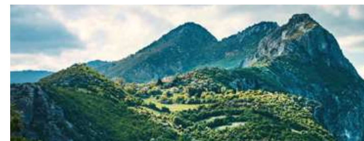
Μεγ.Παρασκευή: Αθήνα - Καλαμπάκα - Γρεβενά

Αναχώρηση 06.50 από Αθήνα με ενδιάμεσες στάσεις για Καλαμπάκα. Άφιξη και ελεύθερος χρόνος για γεύμα και συνεχίζουμε προς το Ελευθεροχώρι, τη γέφυρα του Βενετικού και φτάνουμε στο πέτρινο γεφύρι του Αζίζ Αγά, το μεγαλύτερο μονότοξο γεφύρι της Μακεδονίας. Μετά από σύντομη στάση για φωτογραφίες φτάνουμε στο ξενοδοχείο μας VALIA CALDA 3* , στο Περιβόλι Γρεβενών. Τακτοποίηση στα δωμάτια και μετάβαση στην εκκλησία για την περιφορά του Επιταφίου. Δείπνο.