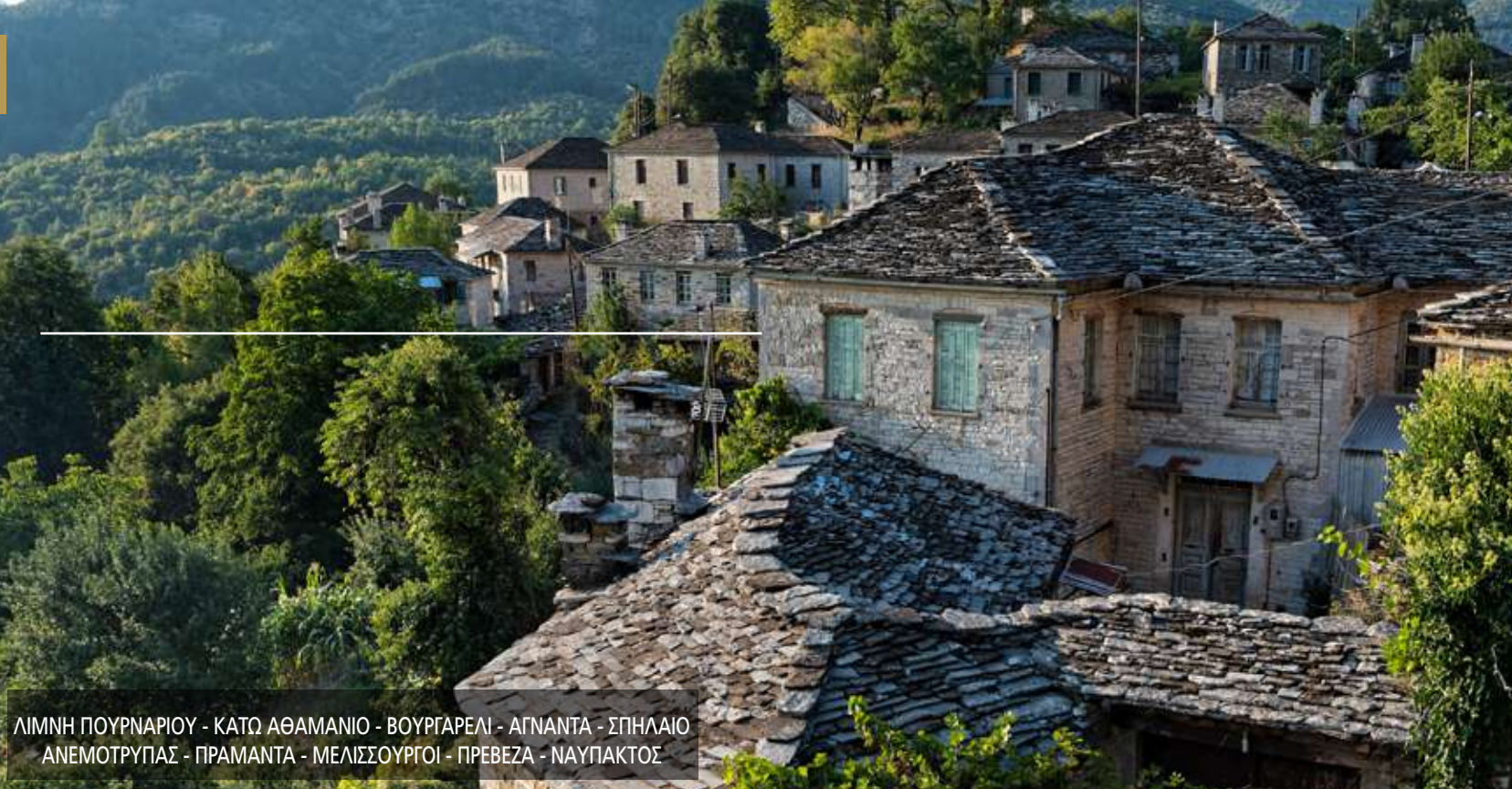
ΛΙΜΝΗ ΠΟΥΡΝΑΡΙΟΥ - ΚΑΤΩ ΑΘΑΜΑΝΙΟ - ΒΟΥΡΓΑΡΕΛΙ - ΑΓΝΑΝΤΑ - ΣΠΗΛΑΙΟ ΑΝΕΜΟΤΡΥΠΑΣ - ΠΡΑΜΑΝΤΑ - ΜΕΛΙΣΣΟΥΡΓΟΙ - ΠΡΕΒΕΖΑ - ΝΑΥΠΑΚΤΟΣ