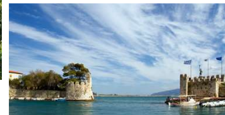
Μεγ.Παρασκευή: Αθήνα - Λίμνη Πουρναρίου - Κάτω Αθαμάνιο Βουργαρέλι - Άρτα

Αναχώρηση 07.20 από Αθήνα με ενδιάμεσες στάσεις και μέσω της γέφυρας Ρίου-Αντιρρίου. Περνώντας από το χωριό Πέτα, όπου έγινε η ιστορική μάχη με τους Τούρκους τον Ιούλιο του 1822, φτάνουμε στις Μελλάτες, για να θαυμάσουμε το υπέροχο θέαμα της τεχνητής Λίμνης Πουρναρίου. Συνεχίζουμε με διαδρομή στο κάτω Αθαμάνιο. Στο Παλαιοκάτουνο θα επισκεφθούμε την Κόκκινη εκκλησία (13ου αι) που έχει πάρει το όνομα της από το χαρακτηριστικό κόκκινο χρώμα των πλινθών της τοιχοποιίας του Ναού. Επόμενος σταθμός μας το Βουργαρέλι, όπου θα θαυμάσουμε τη Μονή του Αγίου Πιόργη, εκκλησιαστικό μνημείο της προεπαναστατικής περιόδου, αφού εδώ κηρύχθηκε η επανάσταση των Τζουμέρκων τον Μάιο του 1821. Χρόνος για γεύμα και το απόγευμα άφιξη στο ξενοδοχείο BYZANTINO 4* στην Άρτα. Το βράδυ μεταφορά για την περιφορά του Επιταφίου. Δείπνο.