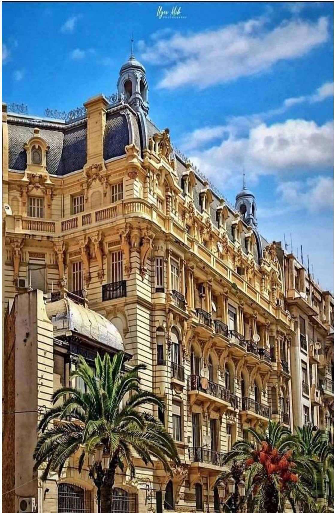
Οράν, άποψη των κτιρίων της πόλης