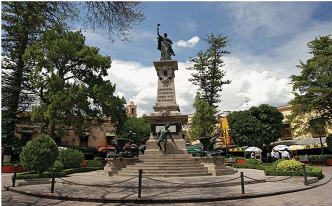
Plaza de la Corregidora