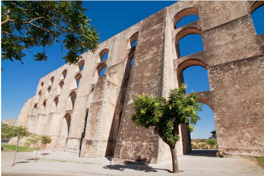
Το υδραγωγείο του Κερέταρο