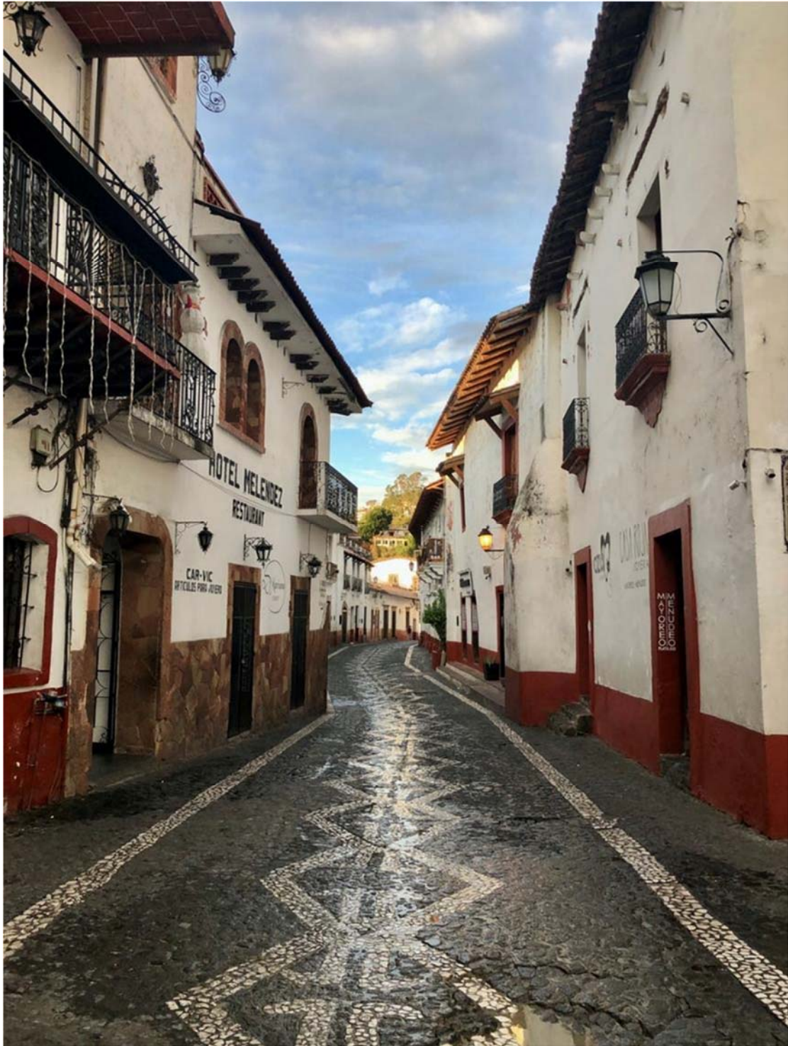
Τάζκο, η πόλη του Ασημιού