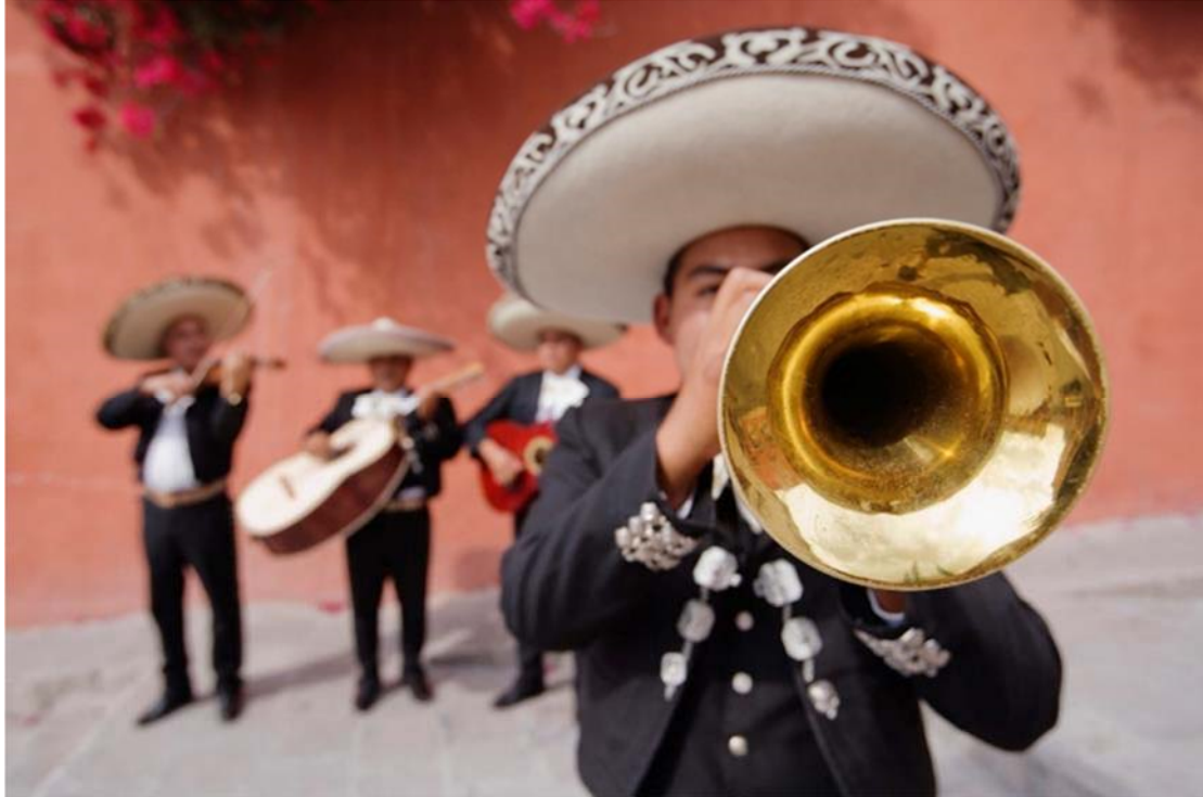
Μαριάτσι στην πλατεία Γκαριμπάλντι

τεκίλας και καντίνες που ετοιμάζουν εμπνευσμένα κοκτέιλ. Έξω από την πόλη υπάρχουν τεράστιες φυτείες γαλάζιας αγαύης από την οποία προέρχεται η τεκίλα. Από εδώ θα μεταβούμε στην δεύτερη μεγαλύτερη πόλη του Μεξικού, την Γουαδαλαχάρα. Η πόλη φημίζεται για την αρχιτεκτονική της, κλασική και μοντέρνα αλλά και τη μουσική της. Στην κεντρική πλατεία ξεχωρίζει ο καθεδρικός και το θέατρο, ενώ στην πόλη ιδρύθηκε και το πρώτο πανεπιστήμιο της Βορείου Αμερικής. Αποκαλείται «πέρλα της Δύσης» και «σίλικον Βάλει του Μεξικού». Μεταφορά στο ξενοδοχείο, εγκατάσταση και διανυκτέρευση.