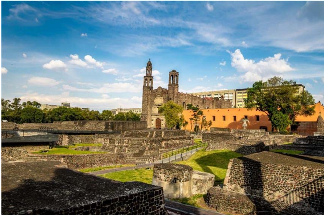
Plaza de tres culturas

Μετά το πρωινό μας αναχωρούμε με πρώτη στάση το σημείο που αποτελεί το σημαντικότερο προσκύνημα για τους Μεξικανούς, την Παναγία της Γουαδαλούπης. Στο σημείο που εμφανίστηκε η Παναγία σε έναν ιθαγενή χτίστηκε η πρώτη εκκλησία που έγινε ο ιερότερος χώρος του Μεξικού. Θα δούμε τον καινούργιο ναό και θα νιώσουμε τη θρησκευτική κατάνυξη των πιστών. Συνεχίζουμε για έναν από τους σημαντικότερους αρχαιολογικούς χώρους του Μεξικού, το Τεοτιχουακάν. Σύμφωνα με τους Αζτέκους στο μέρος αυτό δημιούργησαν οι Θεοί τον κόσμο για αυτό όταν έφτασαν αιώνες μετά οι Αζτέκοι έδωσαν αυτό το όνομα. Το Τεοτιχουακάν υπήρξε σημαντικό αστικό κέντρο μέχρι τον 8ο μ.Χ αιώνα και επηρέασε όλους τους σύγχρονους του πολιτισμούς. Απόδειξη της μεγάλης ισχύος του είναι σήμερα οι τεράστιοι ναοί του. Εδώ, λοιπόν θα θαυμάσουμε και θα εντυπωσιαστούμε από τις διαστάσεις τους το ναό του Ηλίου και της Σελήνης, θα δούμε το παλάτι του Κετσαλπαπαλοτλ και θα περπατήσουμε την κεντρική λεωφόρο.