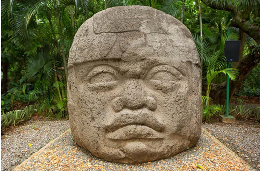
Πάρκο Λα Βέντα

Πρωινό. Δύσκολη αλλά ταυτόχρονα συναρπαστική η σημερινή μας διαδρομή θα μας οδηγήσει βαθιά στο τροπικό δάσος κοντά στα σύνορα με τη Γουατεμάλα, εδώ που ξεπροβάλλουν μυστηριώδη αλλά και γοητευτικά τα ερείπια των ναών του Μποναμπάκ και του Γιαχτσιλάν. Στο Μποναμπάκ θα συναντήσουμε και τους φύλακες της περιοχής, τους ιθαγενείς Λακαντόν με τους λευκούς χιτώνες και τα μακριά μαλλιά, ενώ θα εντυπωσιαστούμε από τις ωραιότερες τοιχογραφίες των Μάγια. Το Γιαχτσιλάν θα μας μαγέψει με τη φύση του και την αρτιότητα των κτιρίων της παραποτάμιας αυτής πολιτείας. Αργά το απόγευμα καταλήγουμε στη Βιγιαερμόσα.