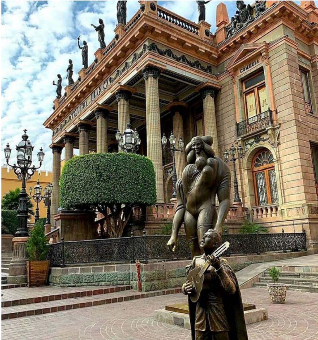
Το θέατρο Χουάρεζ