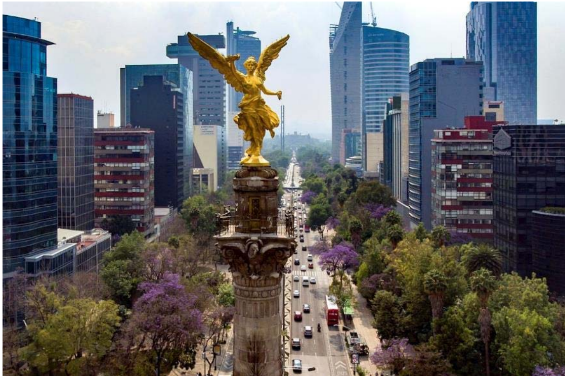
Paseo de la Reforma, Mexico City

Αναχώρηση για το Μέξικο Σίτυ, την πρωτεύουσα της χώρας και μεγαλύτερο αστικό κέντρο του κόσμου με 25 εκατομμύρια ανθρώπους! Μεγάλη, χαοτική αλλά και όμορφη, χτισμένη στα 2.250 μέτρα εκεί που κάποτε υπήρχε μια λίμνη! Εκεί που κάποτε οι Αζτέκοι είχαν μεγαλουργήσει. Εκεί που η ιστορία μπλέκεται με τον μύθο.