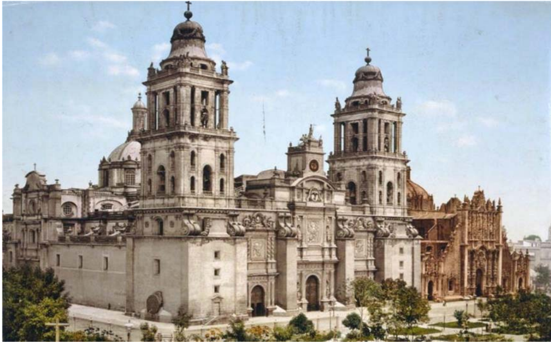
Ο καθεδρικός Ναός της πόλης του Μεξικό

το Προεδρικό Μέγαρο , η τεράστια σημαία της χώρας που κυματίζει στο κέντρο της πλατείας και τα ερείπια της Τενοξπιτλάν , της παλιάς πρωτεύουσας των Αζτέκων και το μοναδικό Μουσείο Ανθρωπολογίας όπου εκτίθενται οι ανεκτίμητοι θησαυροί όλων των προκολομβιανών πολιτισμών της χώρας είναι τα σημεία που θα κεντρίσουν το ενδιαφέρον μας.