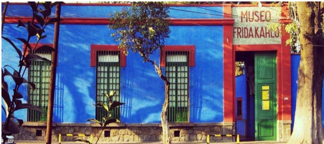
Το σπίτι της Φρίντα Κάλο

Το "Paseo de la Reforma" , η εντυπωσιακή λεωφόρος με το χρυσό άγαλμα του Αγγέλου της Ανεξαρτησίας και τις προτομές των πλέον διάσημων προσωπικοτήτων της χώρας, η θορυβώδης πλατεία των μουσικών "Μαριάτσι", ο πανύψηλος πύργος "Torre Latinoamericana" και η ζωντανή περιοχή της "Zona Rosa" , με τα πιο φημισμένα bar, clubs και μοντέρνα καταστήματα θα συμβάλλουν στη γνωριμία μας με την άκρως ενδιαφέρουσα μεξικανική μεγαλούπολη. Όμως η μέρα μας δεν τελειώνει εδώ. Σε μια γειτονιά της αχανούς πόλης στο Coyoacau, βρίσκεται η Casa Azul , το σπίτι μιας γυναίκας που έγινε σύμβολο της γυναικείας χειραφέτησης, μια καλλιτέχνηδα με εκπληκτικό ταμπεραμέντο που δίχασε για τις επιλογές της και για την ένταση στην τέχνη της. Φρίντα Κάλο! Μια μορφή που άφησε ανεξίτηλη τη σφραγίδα της. Προσωπικά αντικείμενα, έργα και μια αύρα δυναμισμού είναι ό,τι καλύτερο για να κλείσουμε τη μέρα μας.