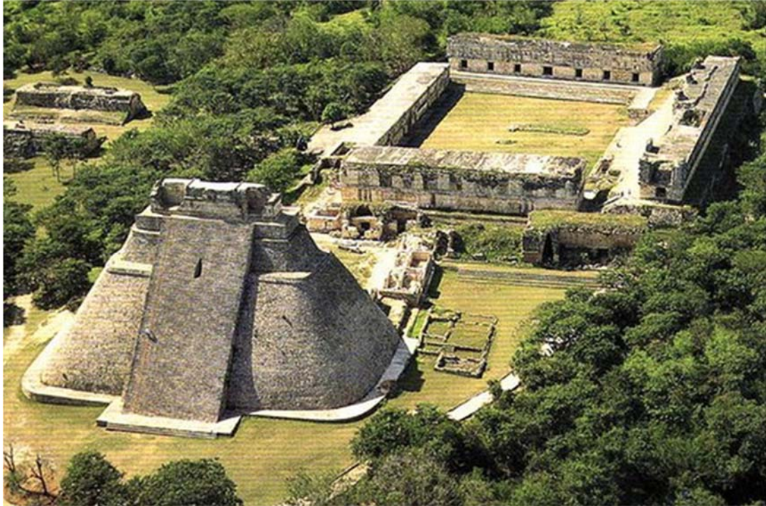
Ο αρχαιολογικός χώρος του Ουξμάλ

οδηγούμεστε στη Μέριδα. Η πόλη είναι σπουδαία και γεμάτη ιστορία. Ατρόμητοι σκληραγωγημένοι κατακτητές και περήφανοι αδάμαστοι ιθαγενείς έγραψαν σελίδες ιστορίας της πόλης. Στο μνημείο της Πατρίδας βλέπουμε ανάγλυφα μπροστά μας την ιστορία της χώρας. Στη λεωφόρο Μοντέχο θαυμάζουμε τα αρχοντικά των πλουσίων γαιοκτήμονων των περασμένων αιώνων. Στη κεντρική πλατεία αντικρίζουμε τους αποικιακούς θησαυρούς.