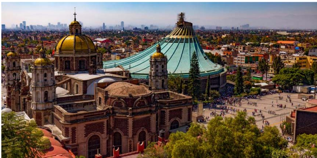
Η παναγία της Γουαδελούπης