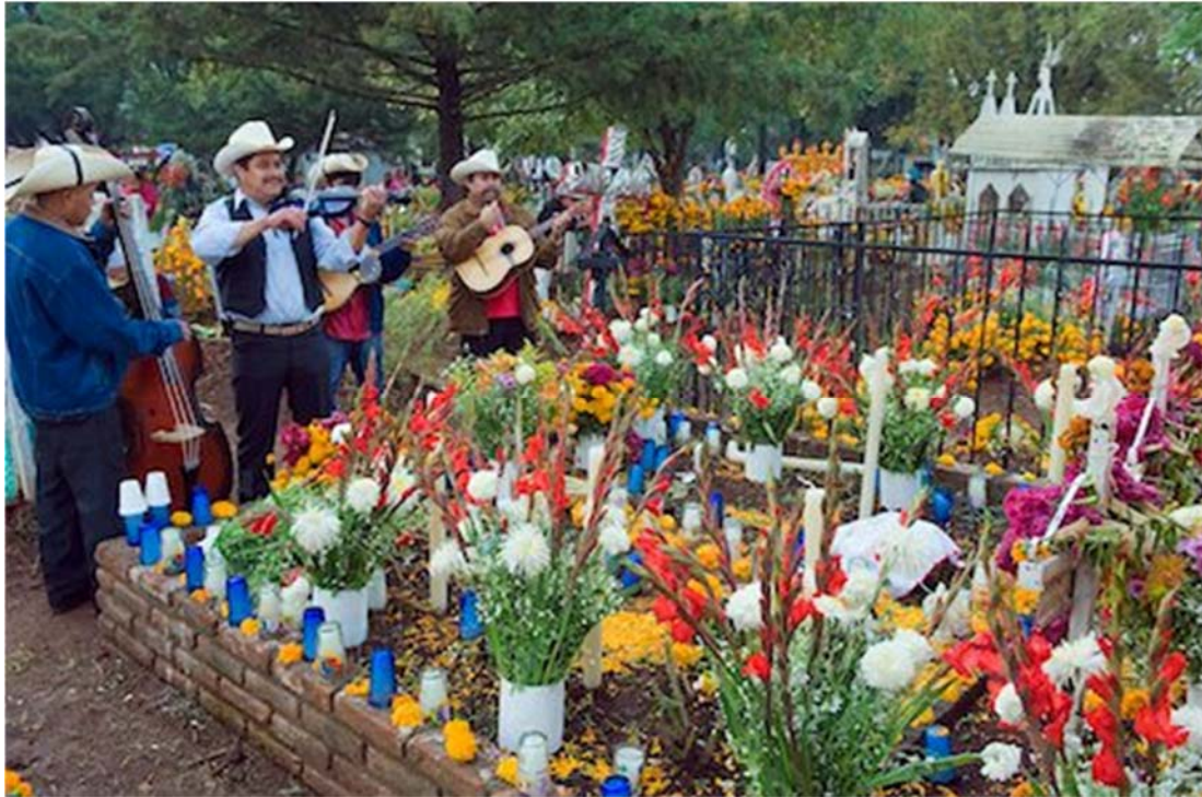
Κοιμητήριο στο Πατσκούάρο

ζωντανούς συγγενείς τους. Ο κόσμος πηγαίνει στα νεκροταφεία, στολίζει τους τάφους, φέρνει φαγητό και ξενυχτά με τους αγαπημένους που έχουν φύγει. Η ατμόσφαιρα είναι συγκινητική, υποβλητική, και αποπνέει το αίσθημα της στοργής και της αγάπης. Η ντία ντε μουέρτος είναι η γιορτή της αγάπης, της ζωής, της οικογένειας. Εμείς σήμερα θα επισκεφτούμε την ευρύτερη περιοχή του Μισσοακάν για να αποθανάτισουμε στη μνήμη μας όσες περισσότερες εικόνες μπορούμε. Στη συνέχεια θα μεταβούμε στο Τζιντζουντζάν όπου θα δούμε τους ντόπιους να επισκέπτονται τα νεκροταφεία με φαγητά, ορχήστρες και μουσική. Η ατμόσφαιρα δε περιγράφεται παρά μόνο βιώνεται. Αργότερα το βράδι θα πάμε στο Κουκουτσούτσο για να δούμε το νεκροταφείο του χωριού. Όσα έχετε στο μυαλό σας για τη συγκινητική ατμόσφαιρα της γιορτής θα τα συναντήσετε εδώ. Οικογένειες μαζεμένες στους ντυμένους με κατιφέδες τάφους των δικών τους υπό το φως των κεριών, κατανυξη, συγκίνηση και θαυμασμός. Γεμάτοι συναισθήματα επιστρέφουμε στο ξενοδοχείο μας στην περιοχή της Μορέλια.