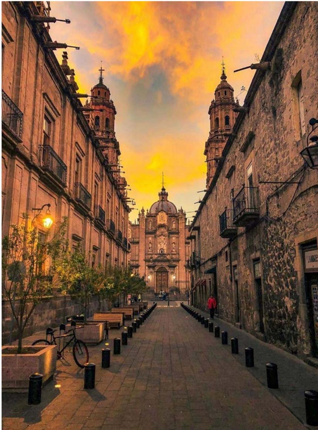
Μορέλια, η πόλη κόσμημα του βορρά!